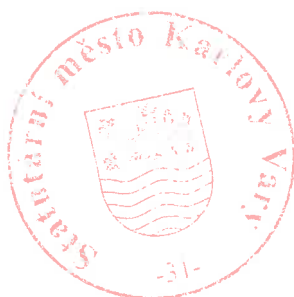
..... Ing. Daniel Riedl vedoucí odboru rozvoje a investic

vzala na vědomí termín dokončení díla k 25.8.2017 z důvodů přerušení stavebních prací ve dnech 7.7.2017, 11.7.2017, 15.8.2017 a 16.8.2017 (nevhodné klimatické podmínky) – viz. zápisy ve stavebním deníku, přičemž lhůta pro provádění stavby stanovená ve smlouvě o dílo se nezměnila.