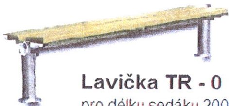
Lavička TR - 0 pro délku sedáku 2000

2) Lavička bez opěradla - zinkovaná konstrukce (cena bez dřevěného sedáku)