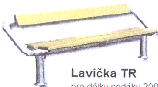
Lavička TR pro délku sedáku 2000

1) Lavička s opěradlem - zinkovaná konstrukce (cena bez dřevěného sedáku a opěradla)