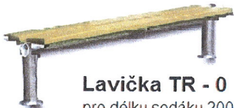
Lavička TR - 0 pro délku sedáku 2000

2) Lavička bez opěradla - zinkovaná konstrukce (cena bez dřevěného sedáku)