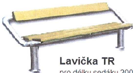
Lavička TR pro délku sedáku 2000

1) Lavička s opěradlem - zinkovaná konstrukce (cena bez dřevěného sedáku a opěradla)