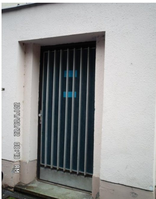
Pohled z venku