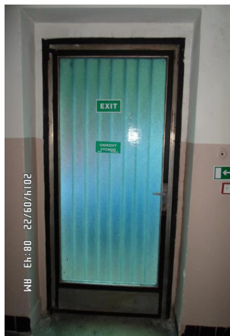
Pohled ze vnitř