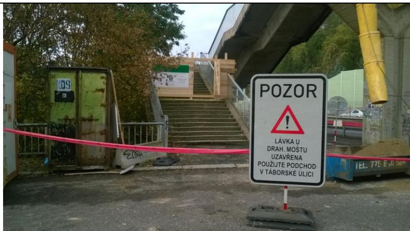
Zajištění vstupu na stavbu nepovolaným osobám.