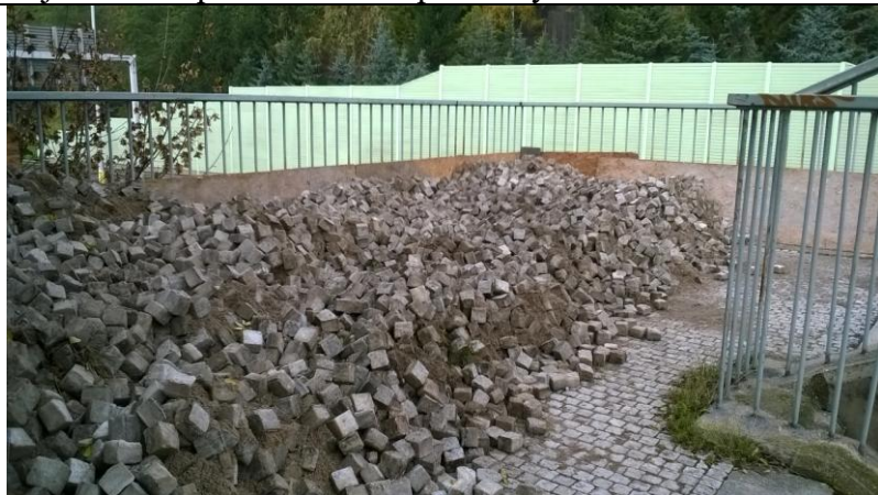
Skladovací plocha byla konzultována s projektantem z hlediska zatížení mezipodesty.