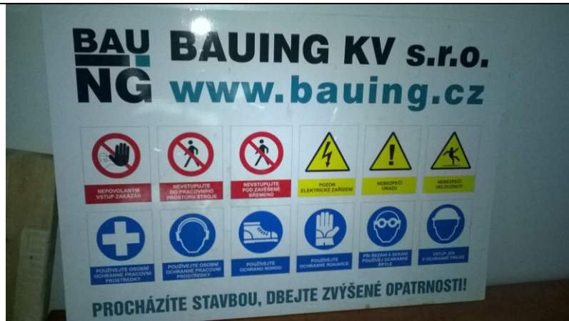
Tabule připravená k osazení na staveništi.