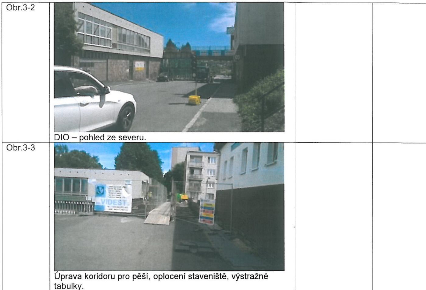
DIO – pohled ze severu.