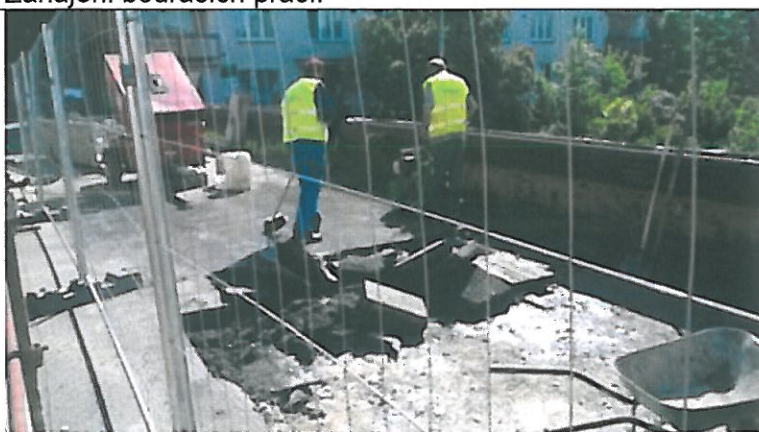
Bourání, řezání živice, úklid.