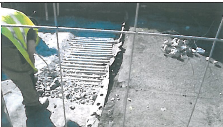
Zahájení bouracích prací.