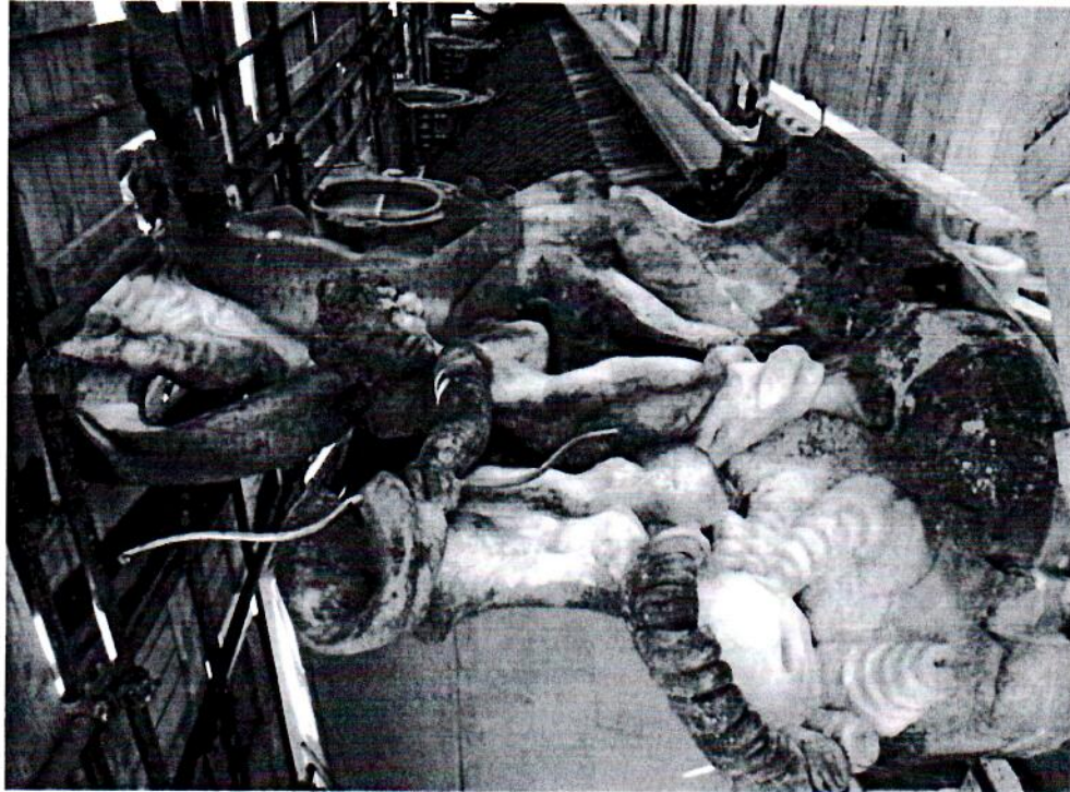
Pohled na levé sousoší z lešení