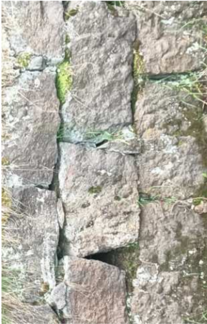
SKUTEČNÁ VAZBA KAMENNÉHO ZDIVA