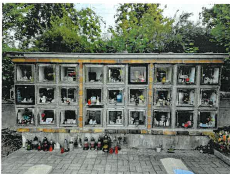
Obrázek 2 - L8