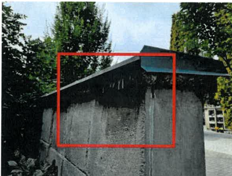
Obrázek 7 - dožilá hydroizolace