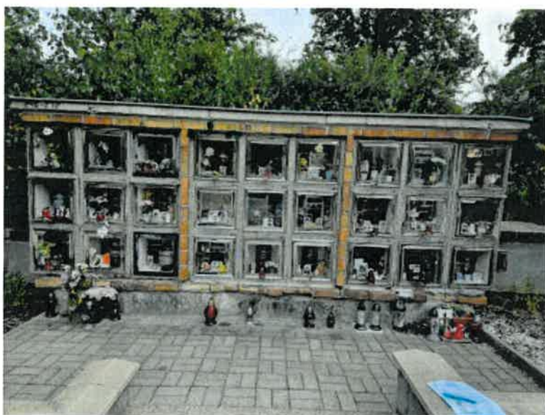
Obrázek 3 - L10