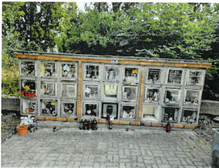
Obrázek 4 - L16

Kolumbária jsou tvořena uzavíratelnými schránkami ve třech řadách s proměnlivým počtem sloupců, nejčastěji s devíti. Tato skupina tvoří vždy samostatnou stavbu/stěnu na zděném soklu se zastřešením pultovou stříškou. V oblasti L jsou kolumbária ve vzdálenosti cca 20 cm od opěrné zídky lemující hřbitov. V oblasti M jsou vedle stěny budovy s obřadní síní a volně stojící.