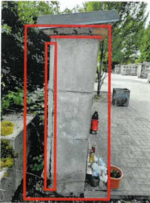
Obrázek 6 - nakloněná konstrukce, degradovaná stříška, odpadávající záda schránek