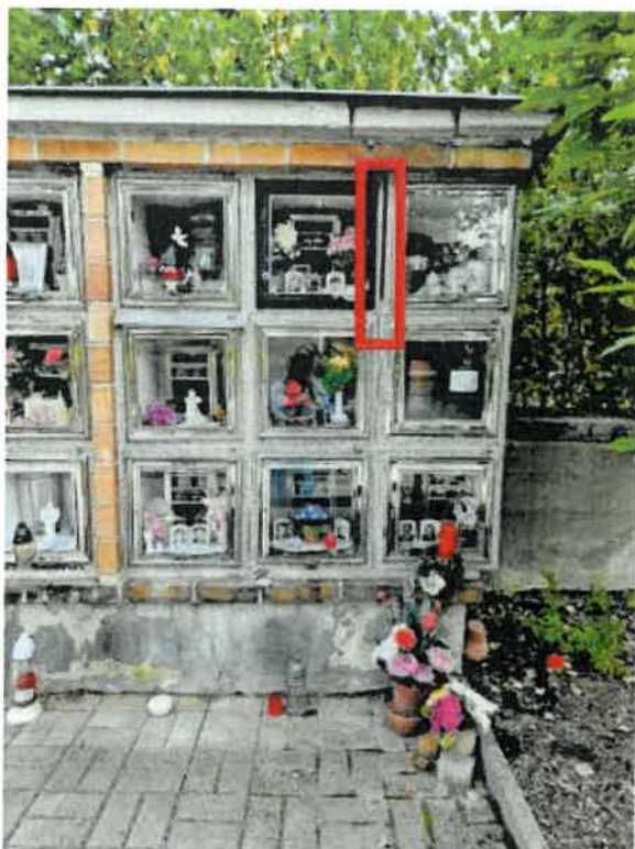
Obrázek 10 - odtržené schránky v blocích