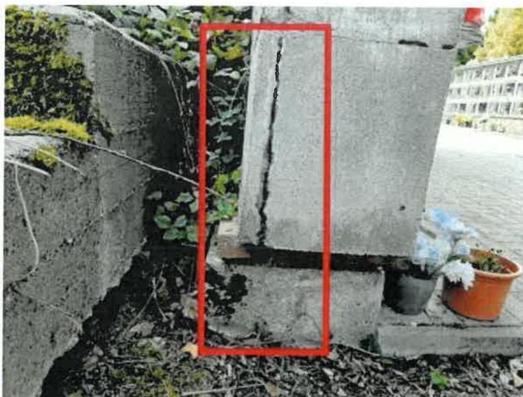
Obrázek 8 - degradovaný a nestabilní sokl