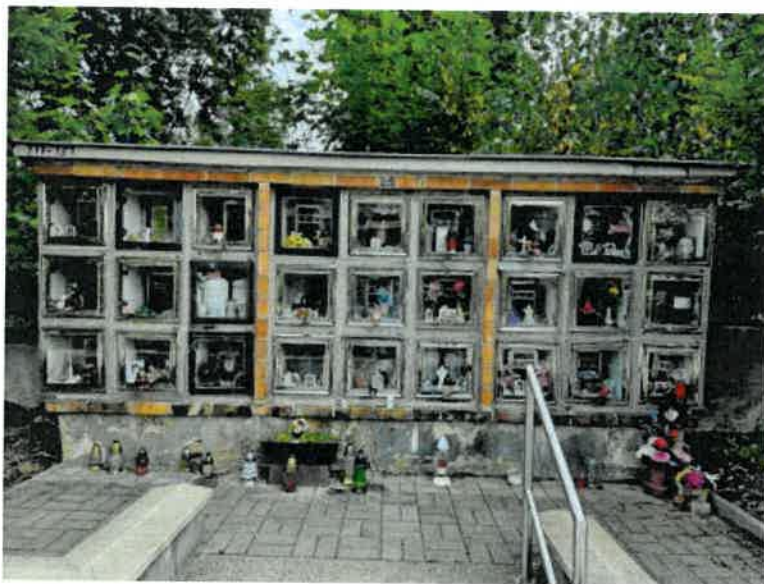
Obrázek 1 - L5

Na hřbitově v Karlových Varech, Buchenwaldská ul., jsou vyhrazeny prostory pro urnový háj. V tomto urnovém háji jsou oddělení s kolumbárii. V oblasti L a M došlo u některých kolumbárií k viditelnému zhoršení stavu. Pro opravu byla zadavatelem vybrána tato oddělení - L5, L8, L10 a L16.