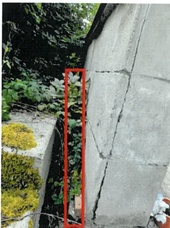
Obrázek 9 - nefunkční odvodnění