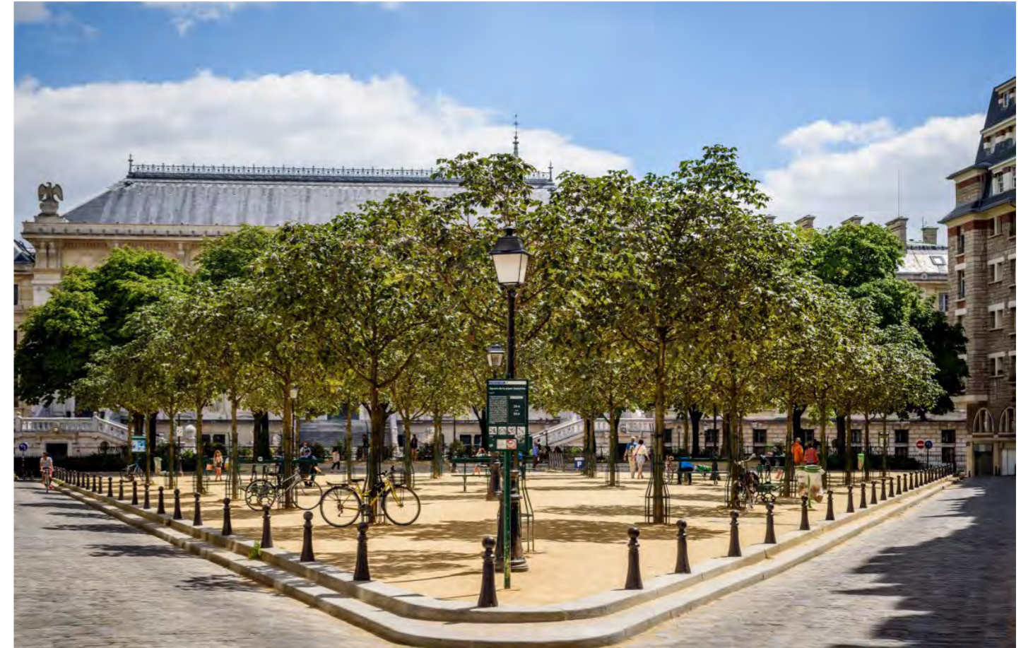
Příklad: mlatový povrch pobytové plochy