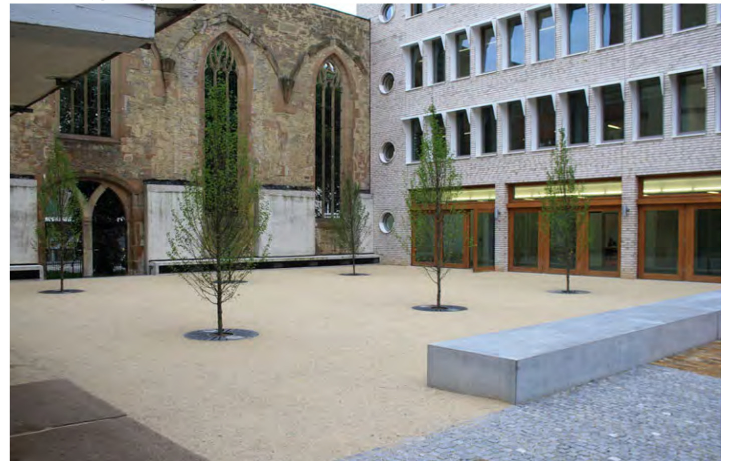
Příklad: mlatový povrch pobytové plochy