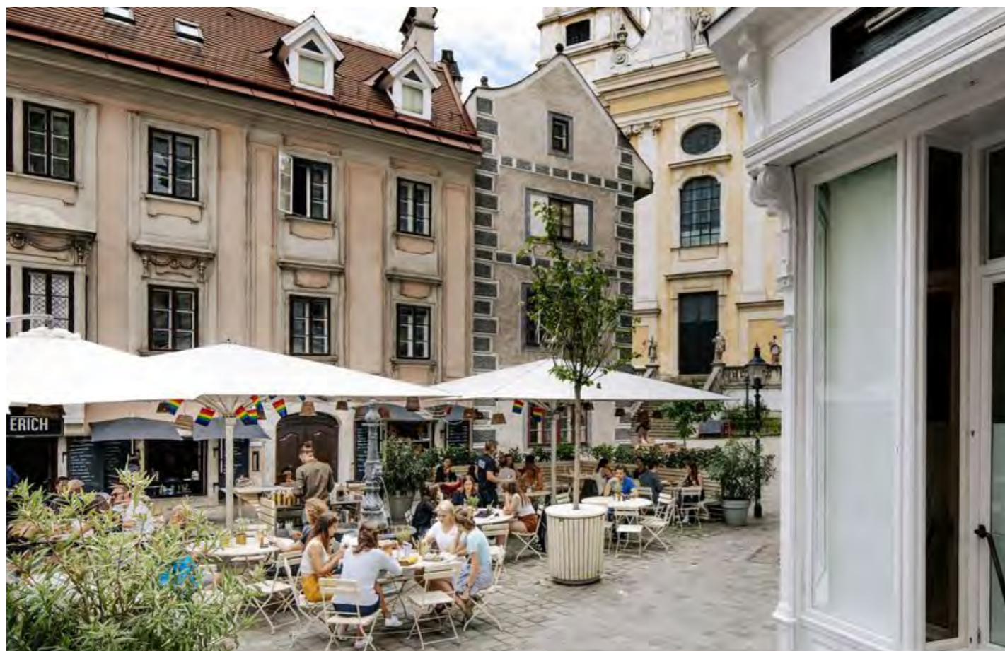
příklad vhodného výběru mobiliáře a zastínění