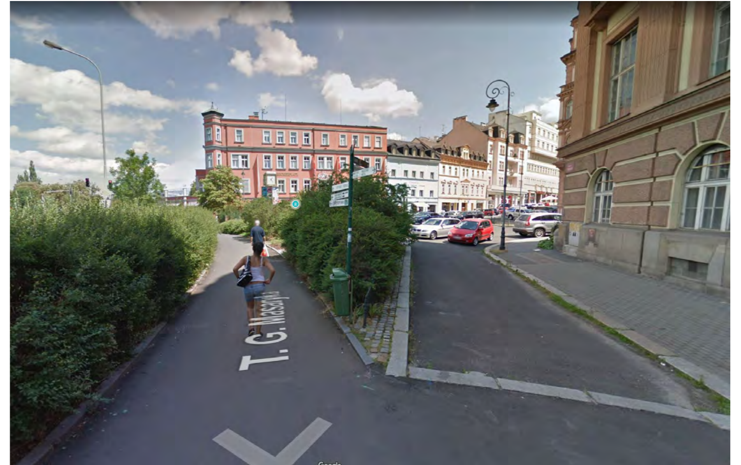
Zmatené materiálové řešení, špatná orientace v prostoru. Hojně využívaná pěší spojnice k Tržnici a Dolnímu nádraží