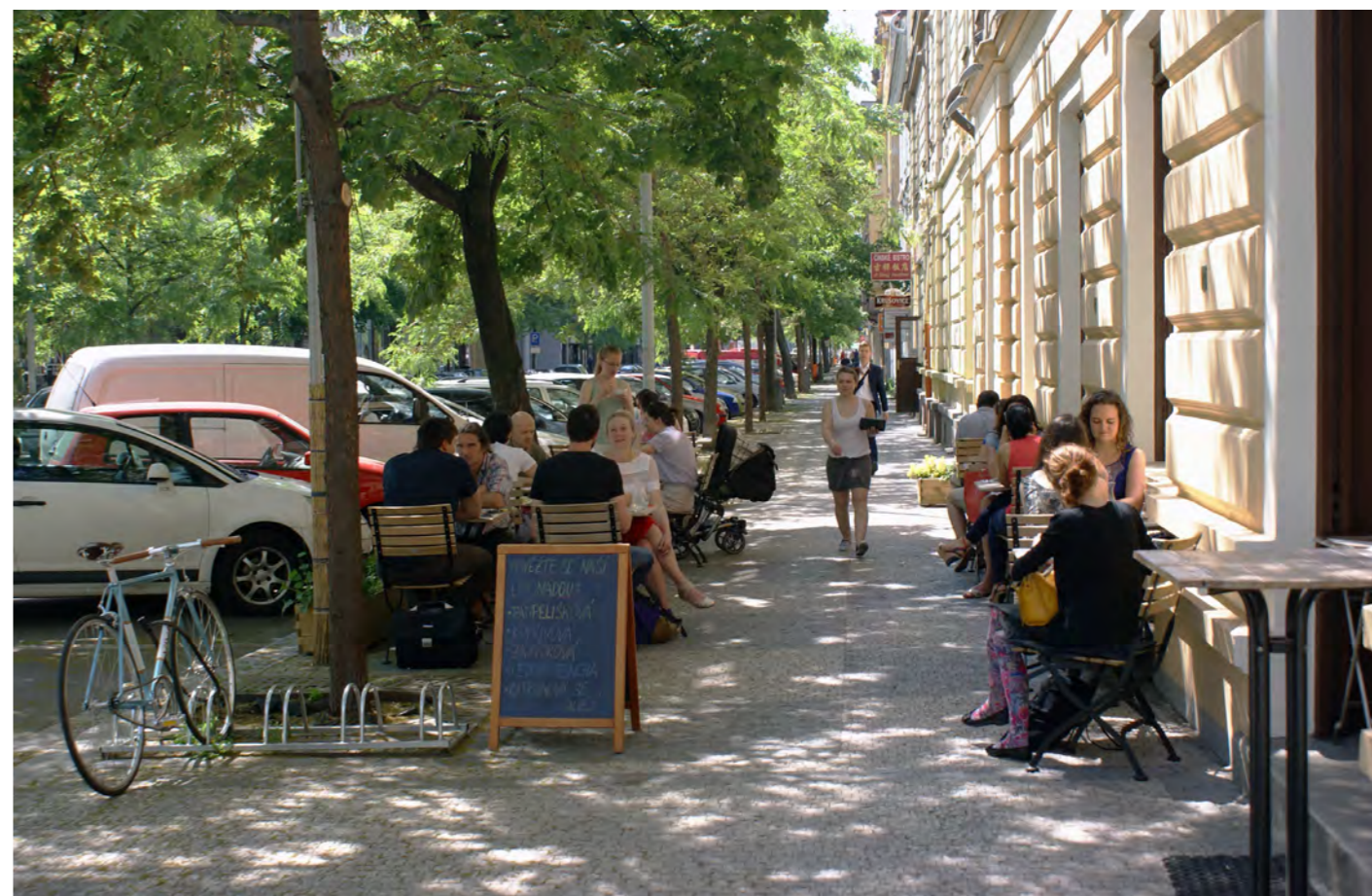
příklad vhodného výběru mobiliáře