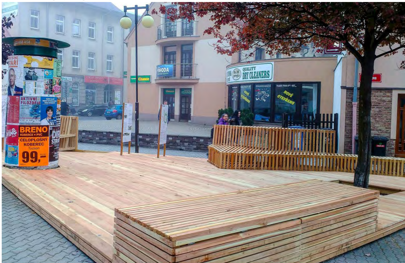
Příklad: dřevěné pobytové platformy