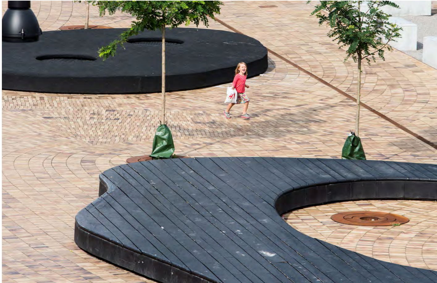
Příklad: dřevěné pobytové platformy