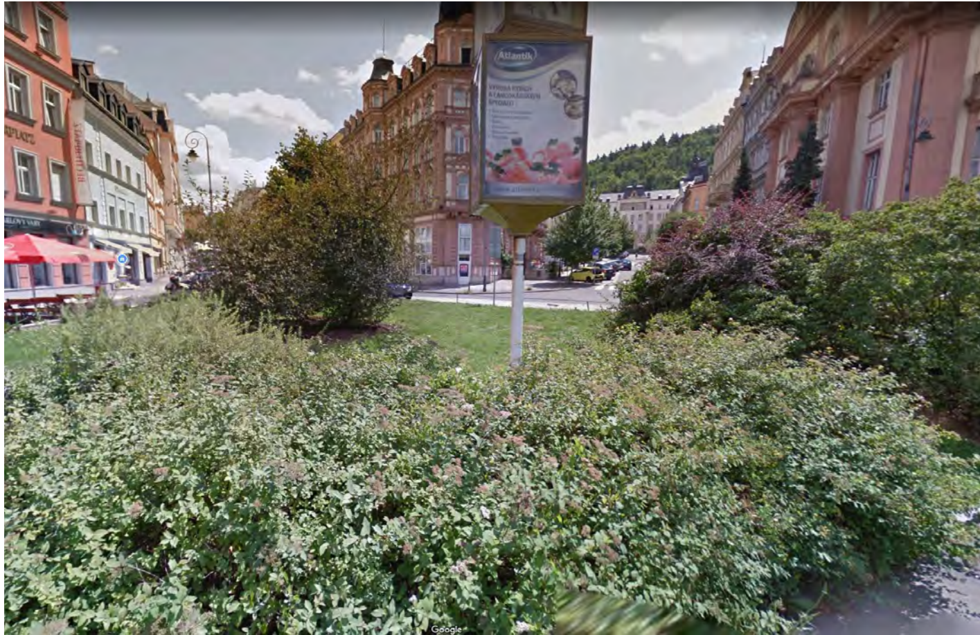
Složité udržovatelná neprostupná plocha