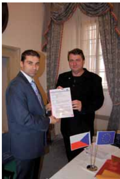
Podpis smlouvy k získání 420 milionů Kč ze strukturálních fondů EU

V letech 2007-2013 můžeme v rámci Regionu soudržnosti Severozápad čerpat rekordně vysoké dotace ze strukturálních fondů Evropské unie. Největší finanční podporu z celé České republiky získal po náročných jednáních právě náš region, tedy Karlovarský a Ústecký kraj. Téměř 20 miliard korun může zásadně podpořit rozvoj měst i venkova, cestovního ruchu, dopravní obslužnosti a zlepšení stavu silnic II. a III. třídy.