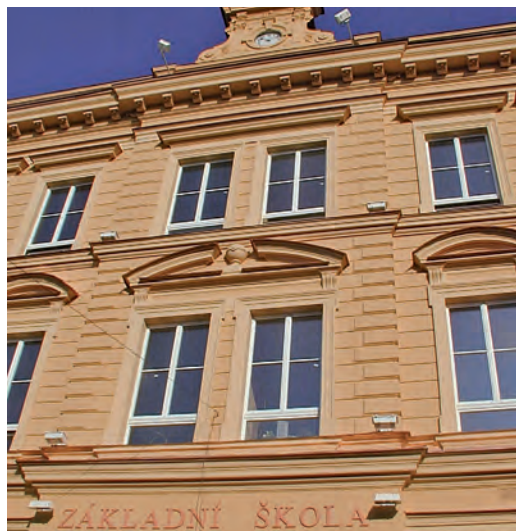
Desítky milionů korun jsou ročně investovány do modernizací školských objektů.

Jen v loňském roce odbor realizoval 17 investičních akcí v celkové hodnotě 644 milionů korun. Rozpočet