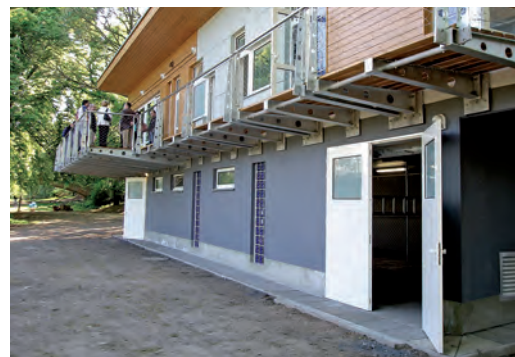
Rekonstrukce se nedávno dočkala také loděnice u Chebského mostu.