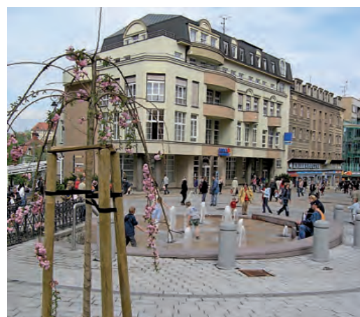
Rekonstrukce komunikací a pěších zón každoročně patří mezi nejvýznamnější investice města.

Kromě revitalizace Staré louky je jednou z největších investičních akcí tohoto roku výstavba bazénu