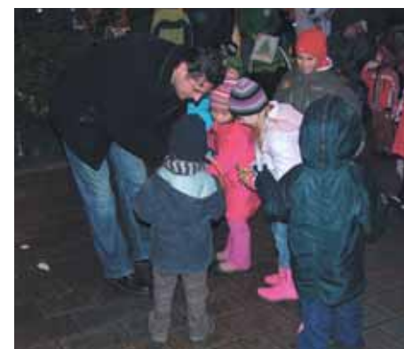
O sladkosti byl mezi přihlížejícími dětmi velký zájem.

Každý z nás měl možnost dětem z Dětského domova Karlovy Vary v Jarní ulici zpříjemnit Vánoce a zakoupit vánoční dárek dle jejich přání. Slavnostního předávání těchto dárců, které se uskutečnilo v rámci doprovodného kulturního programu Vánočních trhů, se zúčastnil i primátor města se svou rodinou. I on se rozhodl připojit k dárcům a věnoval jedné z přítomných dívek poukaz na nákup skript dle vlastního výběru. Celá akce, kterou provázely vánoční písně v podání pěvecké třídy Štěpánky Leitgebové, vyvrcholila zapálením čtvrté svíce na adventním věnci.