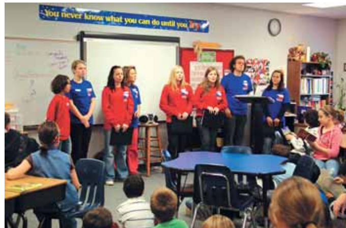
Žáci ZŠ a ZUŠ Karlovy Vary zpívají pro své nové přátele v Texasu

S pomocí zřizovatele – Města Karlovy Vary – se ZŠ a ZUŠ Karlovy Vary podařilo v loňském roce zorganizovat řadu zajímavých a pro žáky přínosných akcí. Rád bych se zastavil u těch, které proběhly na podzim loňského roku.