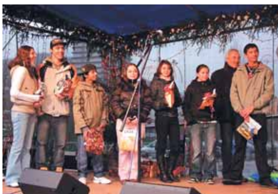
Obdarované děti z Dětského domova Karlovy Vary.