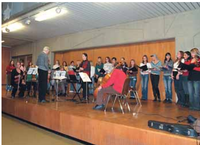
Karlovarský dívčí sbor na adventním koncertě v bavorském Bayreuthu.