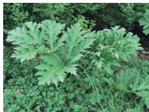
Bolševník velkolepý – vzhledově atraktivní, ale pro člověka poměrně nebezpečná rostlina.

Další významnou oblastí činnosti odboru životního