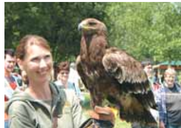
Sokolníci i sokolnice se těšili velkému zájmu.