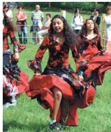
Mladí tanečníci měli úspěch.