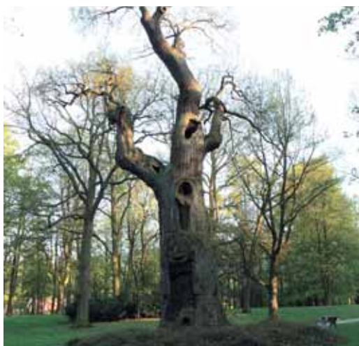
Körnerův dub – památný strom v Dalovicích, patří mezi nejstarší stromy v republice.

Na základě žádosti fyzické nebo právnické osoby, která je vlastníkem pozemku, vydává odbor životního prostředí například povolení o kácení dřevin rostoucích mimo les. „Je-li vlastníkem pozemku, na kterém se daný strom nachází, právnická osoba, musí vždy požádat orgán státní správy o povolení ke kácení. Pokud je však vlastníkem pozemku fyzická osoba, může strom o obvodu kmene do 80 cm ve výši 130 cm nad zemí a keřové porosty do celkové plochy 40 m 2 porazit bez povolení“, vysvětluje Ing. Stanislav Průša, vedoucí odboru životního prostředí. Naopak ze zákona se odbor stará o významné krajinné prvky či o památné stromy, které podléhají přísnějším pravidlům ochrany