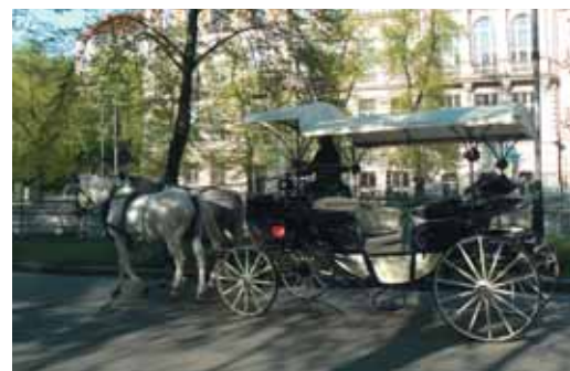
Novelizace zákona na ochranu zvířat proti týrání se dotýká i provozování kočárové přepravy.

Odbor životního prostředí sídlí v budově bývalého okresního úřadu v ulici U Spořitelny. Svou činnost vykonává nejen na území Karlových Varů, ale i v 39 okolních obcích. Úředními dny pro veřejnost jsou pondělí a středa v době od 8 do 12 a od 13 do 17 hodin.