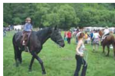
Děti si poprvé prohlédli svět z koňského sedla.