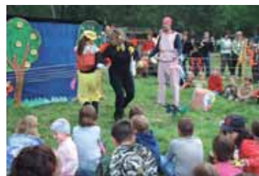
Karlovarské hudební divadlo hrálo pro děti na louce.