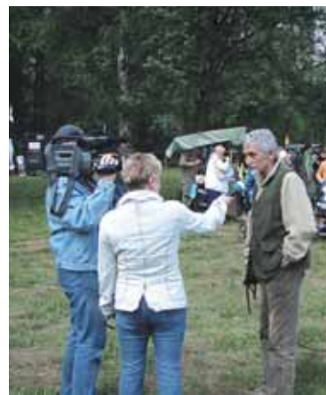
Regionální TV natáčela celý den.