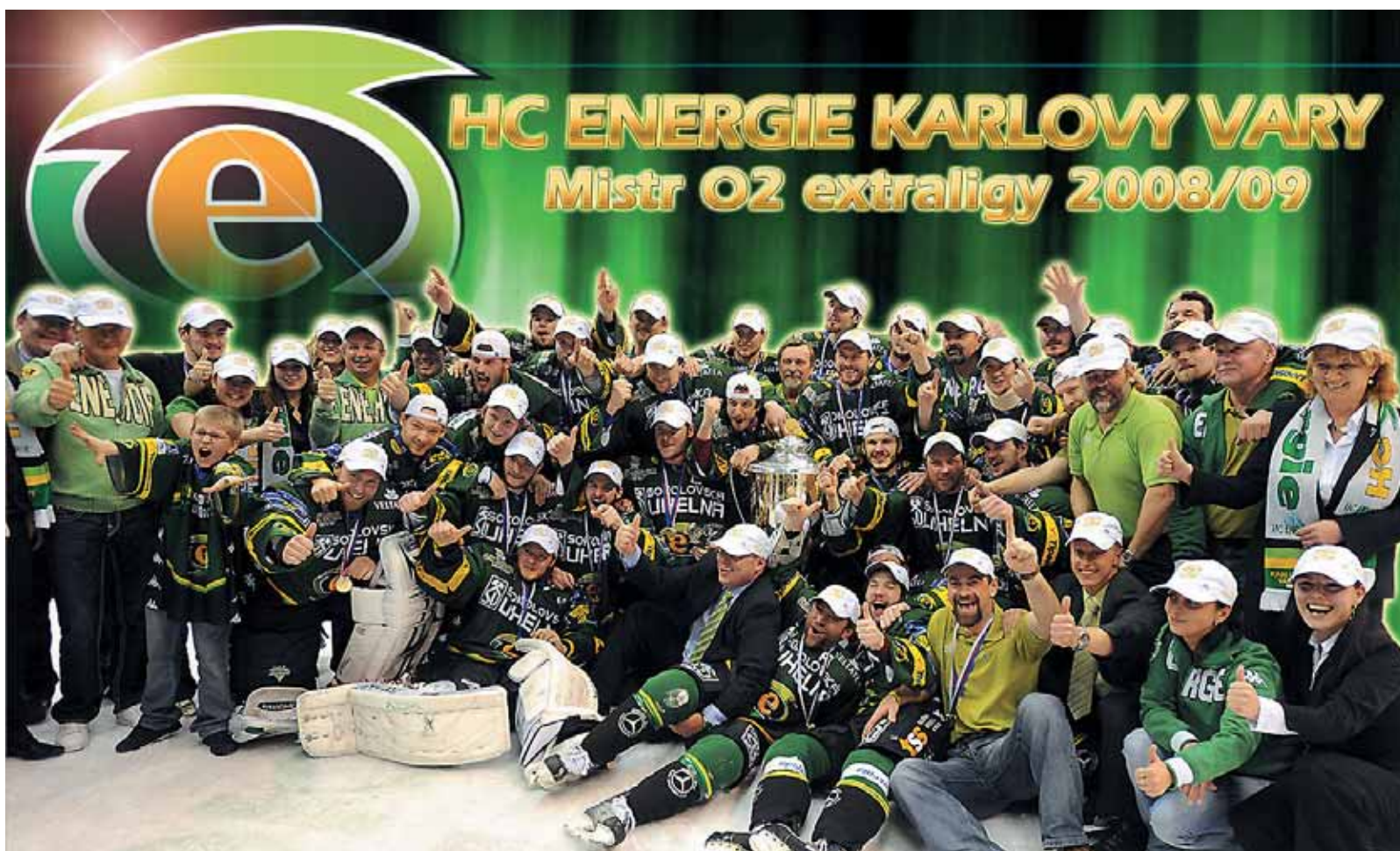
Hokejisté HC Energie Karlovy Vary se v dubnu 2009 stali poprvé v dějinách karlovarského hokeje mistry hokejové extraligy! Gratulujeme k tomuto historickému úspěchu a přejeme hodně štěstí do nové sezony v multifunkční aréně!