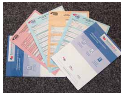
„Jednotný registrační formulář“ je přehledný a nahrazuje různé typy formulářů pro podání, které musel v minulosti podnikatel učinit.

nikatelům. Mezi nejdůležitější změny patří zrušení vydávání živnostenských listů a koncesních listin a jejich nahrazení výpisem ze živnostenského rejstříku. Výpisy obsahují celkový počet živností provozovaných podnikatelem včetně změn s aktuálními údaji.