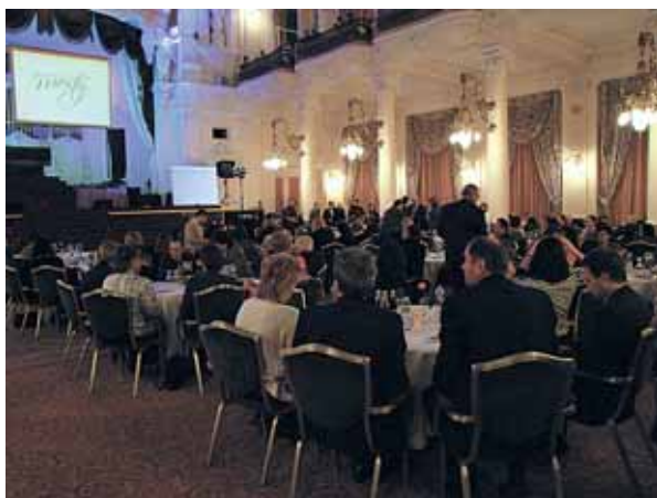
Karlovarský Grandhotel Pupp hostil 6. ročník předávání výroční ceny Mosty 2008.

Dne 17. února se v Karlových Varech konal 6. ročník slavnostního předávání výroční ceny Národní rady osob se zdravotním postižením (NRZP) ČR MOSTY 2008. Smyslem ceny je ocenit akt, projekt či osobnost, jenž významným způsobem zlepšuje postavení občanů se zdravotním postižením v České republice. Udílení této ceny podporuje jednak vznik nových zajímavých projektů, ale také větší mediální prezentaci této problematiky a širší zapojení veřejnosti.