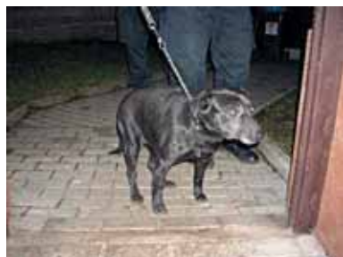
DÁŠA – nalezená 8. 12. 2008 v Jáchymovské ulici, kříženec, 1-2 roky

Chodovská ul., Karlovy Vary - Dvory II. tel.: 353 590 346 www.utulekpropsy.cz info@utulekpropsy.cz