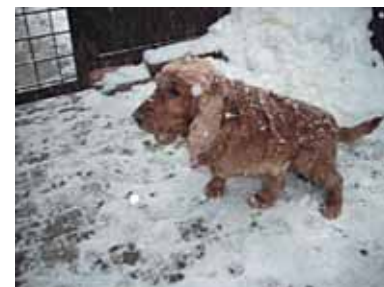
BOBINA – v útulku od 10. 2., fenka kokra, 2-3 roky