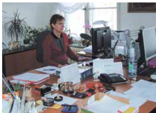
Zaměstnanci živnostenského úřadu mají na starosti nejen podnikatele z Karlových Varů, ale také z dalších 39 okolních obcí, případně z celé republiky.

V červenci loňského roku vstoupila v platnost novela živnostenského zákona, jejímž cílem bylo zejména snížení administrativní zátěže podnikatelů a usnadnění vstupu do podnikání mladým a začínajícím pod-