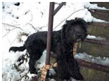
BOBEŠ – uvázan u útulku, kříženec, 1 rok