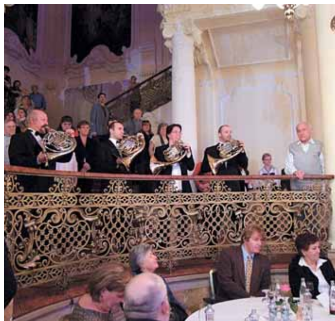
Součástí bohatého kulturního programu byly i Karlovarské Fanfáry.