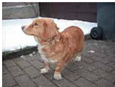
BETYNKA – vrácená 8. 2., kříženec, 1-2 roky