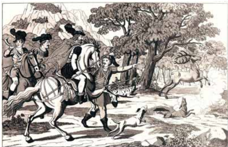
Kaiser Karl IV. entdeckt 1370 die Quellen des Karlsbader bei seiner Hirschjagd durch seinen Spielball, sowie die Quellen heiliger Quellen, Heiligtümer und Fischweiden. (Wien, bei C. Krieger)