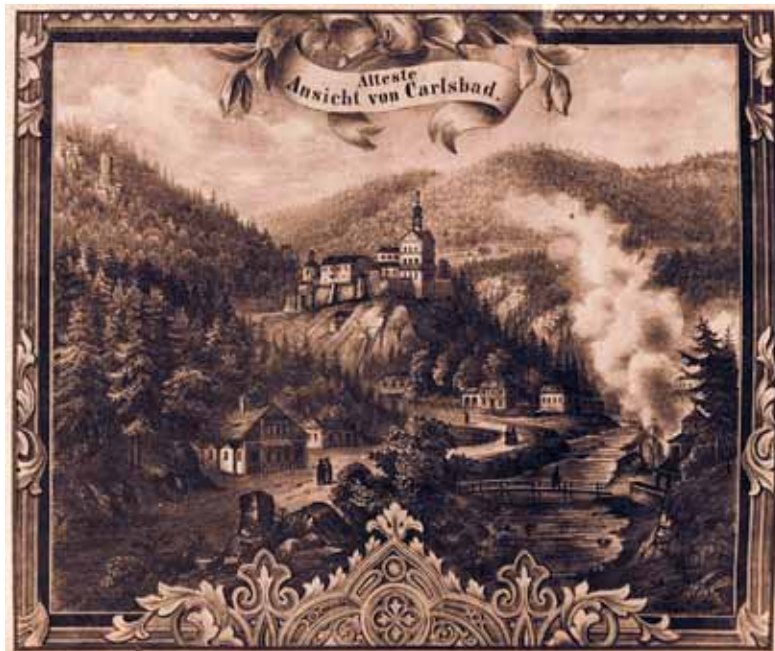
Imaginární vyobrazení Karlových Varů v roce 1358, litografie z roku 1858

Při této Karlově návštěvě se v Karlových Varech uskutečnil slavnostní státní akt, udělení léna. Moravský markrabě Jan Jin-