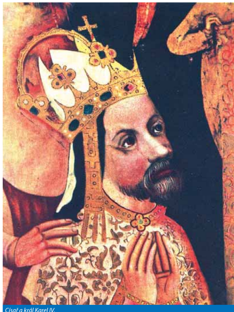
Císař a král Karel IV.

(Překlad opisu listiny ze 16. století, originál je nezvěstný)