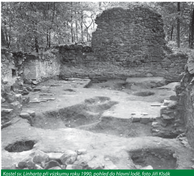
Kostel sv. Linharta při výzkumu roku 1990, pohled do hlavní lodě

Archeologické práce v kostele byly Karlovarským muzeem zahájeny v roce 1989 sondáží za účelem stanovení úrovně podlah a zjištění zachovalosti detailů v interiéru, které měly být inspirací k dalšímu archeolo-