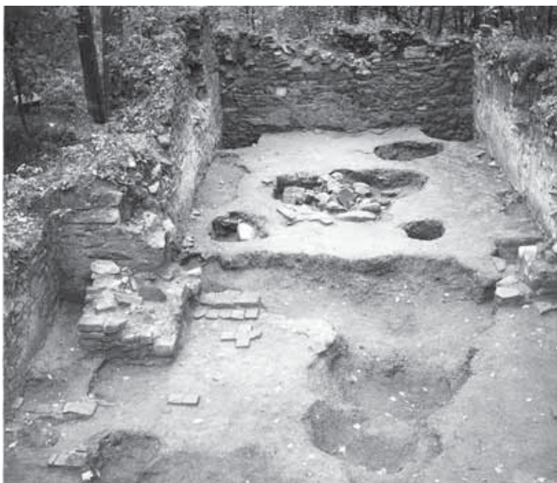
Kostel sv. Linharta při výzkumu roku 1990, pohled do presbytáře

gickému výzkumu. Pokračovali pak v roce 1990 odstraňováním sutě v interiéru a začištěním vykopané plochy na úroveň poslední fáze podlahy. Podlaha byla vytvořena maltovou vrstvou, do níž byly zapuštěny čtvercové cihlové dlaždice, v presbytáři šikmo k ose kostela, v hlavní lodi souběžně. Také obnažené zdi přinesly zajímavé poznatky, lomový kámen byl pospojován vápennou maltou s příměsí vřídlovce, vzácně se na zdi zachovala silnější hlazená vápenná omítka. Mezi presbytářem a hlavní lodí byly potvrzeny zbytky základů pilířů triumfálního oblouku, mezi nimi byly zachyceny zbytky modelovaného kamenného prahu. V severní a jižní stěně byly objeveny kónické vstupy, severním se přicházelo od vesnice, jižním se vstupovalo na přilehlý hřbitov. V severovýchodním i jihovýchodním rohu hlavní lodi