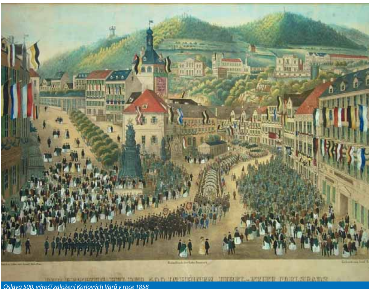
Oslava 500. výročí založení Karlových Varů v roce 1858