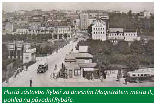
Hustá zástavba Rybář za dnešním Magistrátem města II., pohled na původní Rybáře.