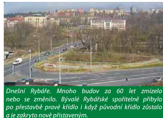
Dnešní Rybáře. Mnoho budov za 60 let zmizelo nebo se změnilo. Bývalé Rybářské spořitelně přibýlo po přestavbě pravé křídlo i když původní křídlo zůstalo a je zakryto nově přístaveným.