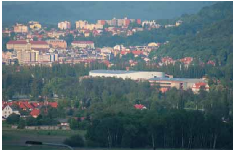
Zábavní a sportovní multicentrum z lokality Pod Rohem u Jenišova.

Pokud máte zájem se o výstavbě dozvědět více, mohu vám doporučit rubriky „Fotogalerie“ a „Letecké snímky“ v odkazu „Výstavba“ na oficiálních webových stránkách společnosti KV Arena - www.kvarena.cz a textové novinky na web průběžně zařazované. Mimořádně zajímavé jsou také virtuální prezentace a měsíčně aktualizované videodokumenty v odkazu „Arena TV“.