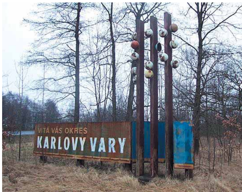
Poutače při vjezdu do Karlových Varů jsou místy ve velmi špatném stavu. Nedávno prošel obnovou poutač při příjezdu od Sokolova.