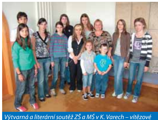
Výtvarná a literární soutěž ZŠ a MŠ v K. Varech – vítězové

Otevření putovní výstavy s názvem „Kulturní dědictví lázní Evropy“, včetně oficiální prezentace výše zmíněného časopisu a průvodce v anglickém a českém jazyce. Od-