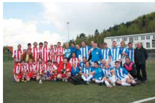
Fotbalové utkání dne 4.5. 2008 na stadionu Slavie u hotelu Martell. Naši politici, TOP REAL Praha a fotbalový tým Evropské komise