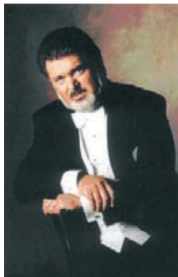
Peter Dvorský - předseda poroty