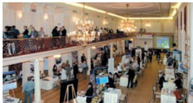
Sál Richmond - Lázeňský workshop 5. 10. 2007, účastnilo se jej přes třicet lázeňských vystavovatelů z České republiky a přes 80 zahraničních účastníků ze 14 zemí světa