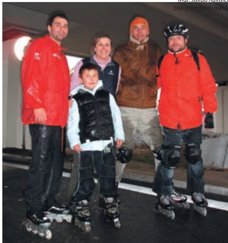
Průtah – Ani silný déšť neodradil při posledním dnu otevřených dveří na průtahu městem Karlovy Vary některé karlovarské radní od myšlenky sjet si jeho dnes už otevřenou část na inline bruslích.