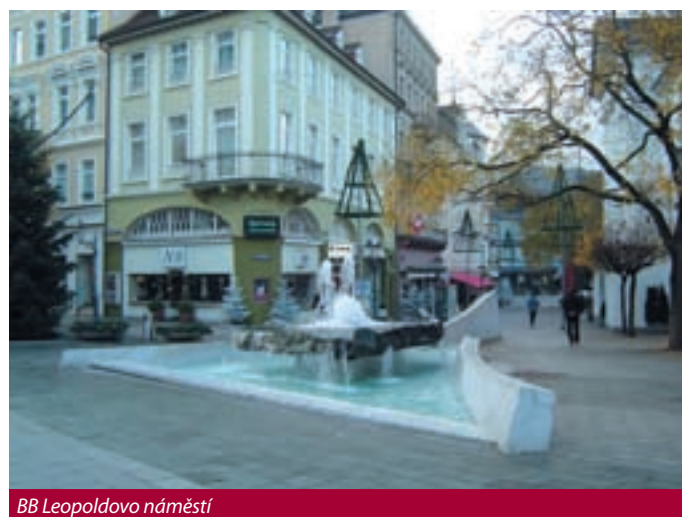
BB Leopoldovo náměstí