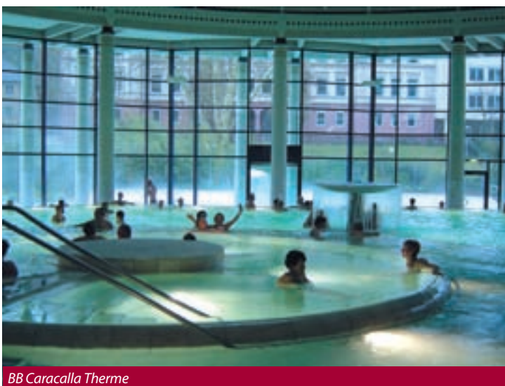
BB Caracalla Therme

Pro karlovarské občany je vynikající adresou restaurace Prager Stuben a Hotel am Friedrichsbad, které patří od roku 1980 rodilému Čechovi p. Proko-