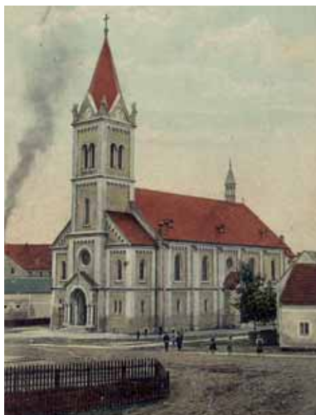
Kostel v roce 1919

Ve Staré Roli kvetla od poloviny 19. století řemesla i obchod a dobře fungovaly služby. Jen za I. republiky bylo ve Staré Roli 27 hostinců, tři hotely, osm pekáren a tři kavárny. Svě služby tu nabízelo 12 holičů, 14 řezníků, čtyři zlatníci a hodináři, 11 obchodů s konfekcí, dva koňští řezníci, dva knihkupci, byla zde tři květinářství, tři železářství a dvě drogerie. Vedle sebe se užívalo šest stavebních a pokrývačských firem, čtyři uhlíři, pět obchodníků s koženým zbožím a kožešnictví. Ve Staré Roli bylo 16 obuvníků, 6 čalouníků, 17 krejčíků a švadlen, 11 truhlářů, tři vetešníci, čtyři mandly a 23 prodejen potravin. Byly zde dvě majitelky módních salonů, osm hudebníků, dva kováři, dvě vinotéky, 7 trafik, 23 soukromých dopravců a tři opravy aut, 16 registrovaných trhovců a dalších 28 živnostníků. Po dvojnásobné žádosti v letech 1910 a 1922 bylo povýšení Staré Role na město potvrzeno 16. 7. 1926 a oznámeno dekretem ministerstva vnitra z 27. 7. 1926. Stará Role byla městem téměř padesát let. Dnem 1. 1. 1976 se stala součástí Karlových Varů.