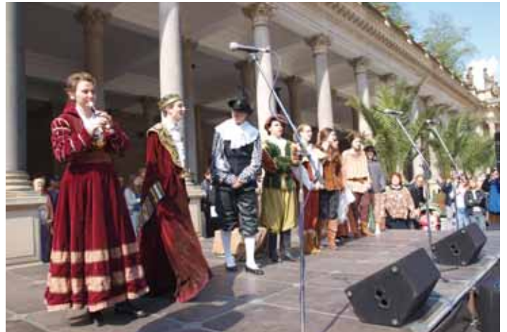
Hlavní program zahájení sezony bude tradičně na Mlýnské kolonádě