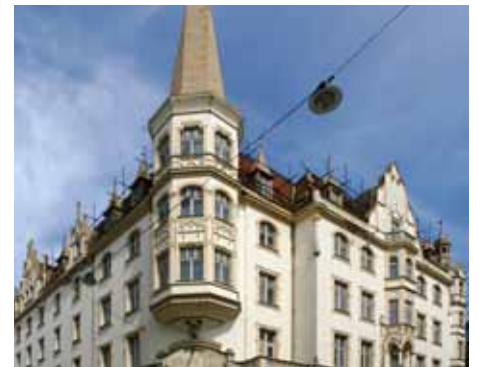
Dnešní stav Národního domu inzerce