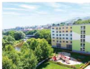
REZIDENCE ČERTOVKA Posledních 6 bytů k nastěhování