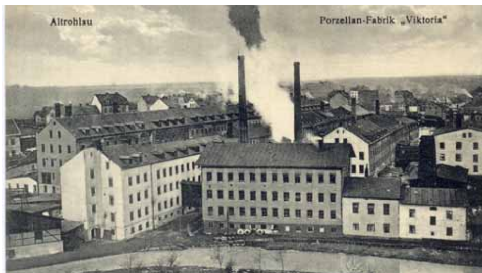
Porcelánka Viktoria v roce 1926