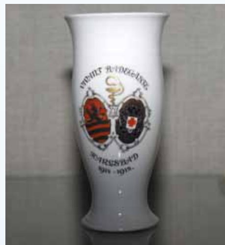
Nejčastějším dekorem byl název lázni Karlsbad (1914–18)

Měnil se také tvar pohárků. Nejprve to byl zvonovitý, později kónický a v poslední době plochý. První tvarová změna je datována na konec 19. století, druhá pak na počátek století 20., kdy se ouško proměnilo s rozvojem modelářských a technologických dovedností v praktickou násosku. Dnes jsou na trhu k dostání pohárky z různých období, různých ve-