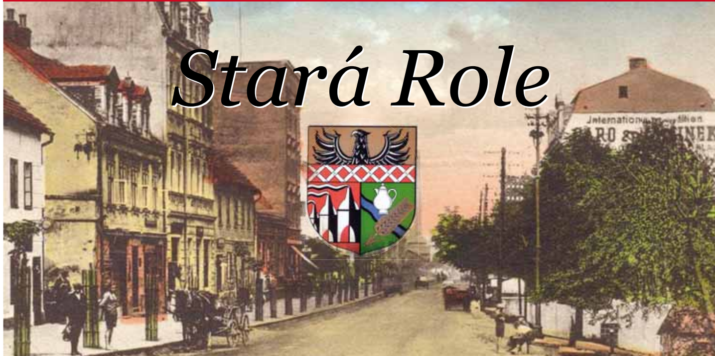
Historie Staré Role kráčela zejména Hlavní ulicí (Hauptstrasse, dnešní Závodu míru). Městský znak, jak ho navrhl prof. Waldemar Fritsch.

Městská část Stará Role se rozkládá na severozápadním okraji Karlových Varů a má rozlohu 529 hektarů. Průměrná nadmořská výška je kolem 392 m/m. Území je tvořeno údolím řeky Rolavy s nejvyššími vrcholy Bažantím vrchem (417 m/m.) a Kukačkou (438 m/m.).