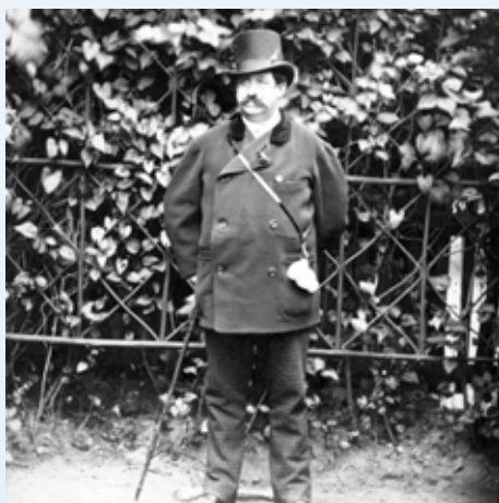
Karlovarský lázeňský host z Petrohradu v roce 1883

likostí a tvarů, s nejrůznějším dekorem. Objevují se i extravagantní kusy. Všechny jsou určeny k pití u pramenů. A všechny vycházejí z lázeňské praxe upravované balneology po staletí a z technologických možností přístupu k pramenům a nabírání vody. V současné době se v našich lázních uplatňuje následující