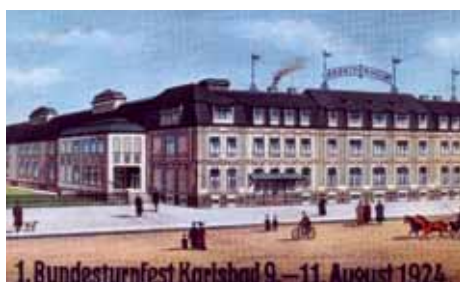
Arbeiterheim – Schulgasse 358 (Školní)

Po zprůměrnění Staré Role přibýlo obyvatel, a tak již v roce 1840, kdy žilo v obci 110 školou povinných dětí, uvažovali o stavbě vlastní školy. V roce 1854 byla zřízena nejprve putovní škola (Wanderschule). V tu dobu nebyla k dispozici žádná vlastní školní budova, a tak vyučování probíhalo střídavě v různých selských jizbách a příslušný majitel poskytl učitelé také stravu. Nová školní budova byla postavena v roce 1857 (dnešní Vančurova ulice). Dostala domovní č. 30 po zbouraném starém hostinci (ban Keckn), který stál v dnešní Javorové ulici na místě domu 361. Za nějaký čas první školní budova nestačila, a tak se přistavěla přední jednopatrová část. Dalším pokračováním bylo rozšíření objektu na východní stranu a později přístavba k západní straně a zvýšení celé budovy (dnes Vančurova 83). V roce 1883 byl položen základní kámen k výstavbě měšťanské školy (Školní 310).