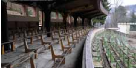
Dnešní podoba tribun, kde stejně jako v celém hledišti byla demontována laminátová sedadla, aby se mohl opravit popraskaný beton

Po dvanácti letech chátrání se dočkal záchrany také karlovarské letní kino. Tam, kde přespávali bezdomovci a rostlo bodláci, pracují dnes desítky dobrovolníků na obnově areálu. Během prvních směn odvezli dvě desítky kontejnerů křovin a odpadků, než mohli začít s demontáží laminátových lavic a odstraněním zkorodovaných stožárů. Teď je zaměstnává bourání betonových stupňů a vytrhání kabelů. Prvním krokem záchrany byl loňský benefiční koncert 5. července s názvem Včera lesní, dnes letní. Přišlo na něj téměř tisíc platících diváků. Předcházela mu petice za záchranu kina, kterou podepsali čtyři tisíce Karlovaráků. Zastupitelé města schválili na letošní rok dva miliony korun na nezbytné úpravy i na zapůjčení promítací techniky od 24. června do 24. července. „Zkušební pro-