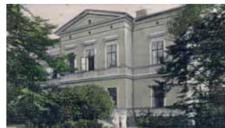
Zámek v roce 1908. Dnes domov důchodců