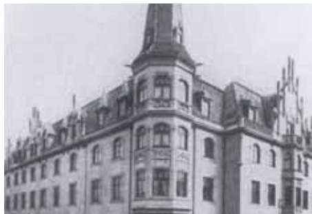
Secesní grandhotel Sřtelnice, dokončený na Silvestra roku 1900 podle vídeňských architektů Ferdinanda Fellnera a Hermanna Helmera.