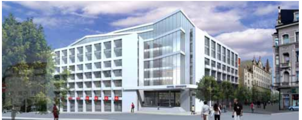
Takhle má vypadat moderní přístavba Národního domu od Tržnice

Dnem 1. dubna vstoupilo v platnost stavební povolení na rekonstrukci a dostavbu hotelu Národní dům. Investorem je pražská společnost Eltodo, práce za téměř miliardu korun provede karlovarský Baus-tav. Jedná se o zatím poslední termín. První termín zahájení rekonstrukce, který vypršel na konci loňského roku, zablokovala MEI Property Services, které patří sousední dům v Jugoslávské ulici. Současné stavební povolení platí do října roku 2012. Původně plánoval investor, že v přístavbě historického objektu budou kromě obchodů, restaurací a kanceláří také nové pokoje hotelu Národní dům. V současných plánech ale již žádná nová ubytovací kapacita hotelu není. Z pohledu města je podstatné, že historický objekt zůstane hotelem. Společnost Eltodo požádala o prodloužení lhůty na dokončení rekonstrukce a dostavby na konec roku 2013. To ale musí schválit rada i zastupitelstvo města. V první etapě rekonstrukce bude vybudováno oplocení, provedou se vykládky a bourací práce. Rekonstrukce se dotkne přilehlých ulic Zeyerovy, Jugoslávské, T. G. Masaryka a Varšavské. Podle stavebního povolení budou tyto ulice zčásti zúženy a omezi se na nich průjezd, průchod a parkování.