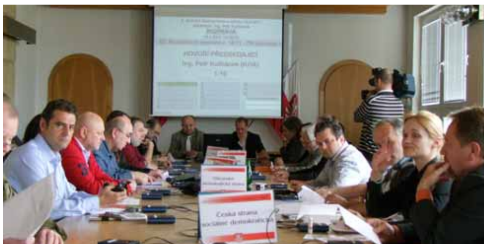
Zastupitelé města na mimořádném zasedání udělali tečku za případem