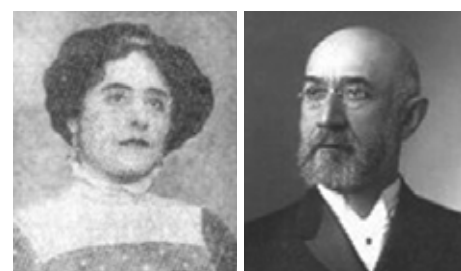
Rosalie Ida Straus (63) a Isidor Straus (67), oběti z Titaniku