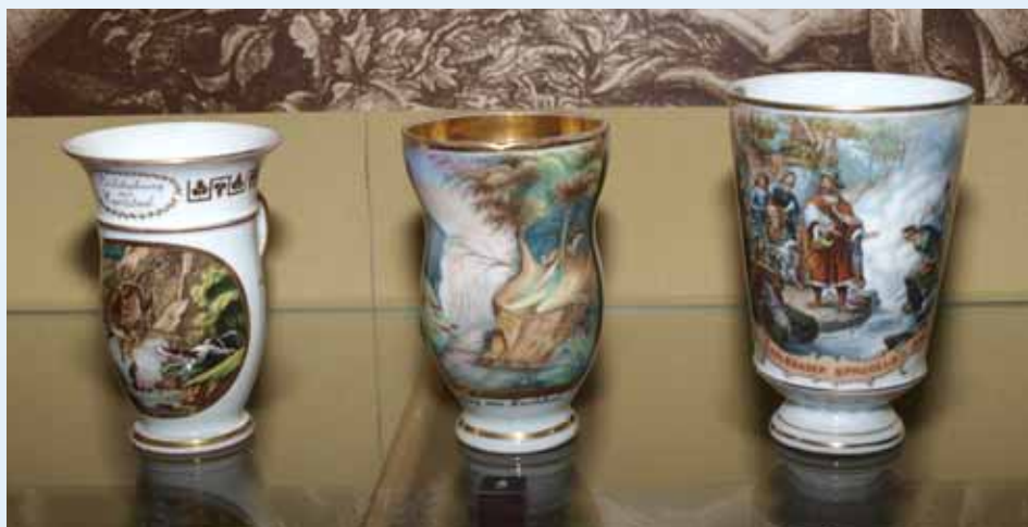
Lázeňské pohárky zdobily i různé výjevy