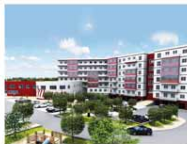
REZIDENCE MOSER Právě začíná výstavba

Po stagnaci realitního trhu v posledních dvou letech jsou již ceny nových bytů na minimu. Nemůžeme očekávat, že se plánované zvýšení DPH nepromítne do konečných cen bytových projektů. V dalších letech jistě nebude cenová nabídka tak příznivá jako je právě dnes, jelikož nebudeme schopni navýšení o DPH pokrýt ze svých marží. Je vhodná doba využít současného poklesu cen ke koupi bytu. Zvýšení daně z přidané hodnoty může prodražit cenu bytu až o statisíce korun. Jak jsem zmínil viz. výše, nyníjší koupě bytu je výhodnou investicí do budoucna a právě s plánovaným zvýšením DPH bych s koupí bytu neotálel.