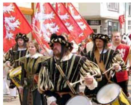
Bubeníci, zbrojnoši a další postavy královny družiny budou i letos v průvodu