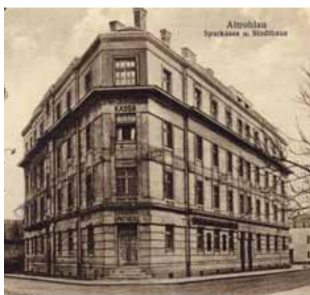
Nová radnice a spořitelna – Hauptstrasse 386 a 387 (Závodu míru) Dnes PČR

Nejvýznamnější stavbou je bezesporu kostel Nanebevstoupení Páně, postavený zásluhou mnoha lidí a sbírkami korunu po koruně. Mít svůj kostel byla pro obec čest. Kostel byl slavnostně vysvěcen 10. října 1909 kardinálem Lvem Skrbenským. Druhou významnou stavbou je nová radnice, kterou tvoří dvojdom č. 386 a 387 (dnes Závodu míru). Stavba se prováděla na místě strženého domu č. 8. Po velkých obtížích byla dokončena během roku 1924. Obecní kanceláře byly do nové budovy přestěhovány 6. 1. 1925. V roce 1928 koupila místní spořitelna polovinu objektu. Třetí z významných staveb je zámek, který na místě zvaném am Leckplatz (dnes Závodu míru č. 88) nechal roku 1862 vybudovat Emanuel Nowotny. Provedením se dům zřetelně odlišoval od tehdejších staveb, což také vysvětluje jeho pojmenování. Zámek se také říkalo vila. Ve výklencích vnější výzdoby byly dvě sochy, vytvořené slavným sochařem Tomášem Seidanem. Zámek je v současné době domov důchodců.