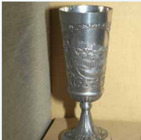
K výrobě pohárků posloužil nejprve cín, přezdívaný stříbro chudých

ale i po návratu z lázni zůstávaly majitelům jako suvenýr. Koflíky byly nejčastěji z porcelánu a ze skla. Vyráběly je četné porcelánky v okolí Karlových Varů, výtečnou výtvarnou úroveň se vyznačovaly pohárky z manufaktur v Březové a Horním Slavkově. V polovině 19. století se koflíky tvarovaly tak, aby během lázeňské vycházky nepřekážely. Mnohdy se po způsobu kukátek či dalekohledů nosily v koženém pouzdře zavěšeném přes rameno. Na sklonku 19. století se začaly vyrábět koflíky s dutým ouškem, jež sloužilo a dodnes slouží k pohodlnému nasávání termální vody do úst. Důležitou součástí pohárku byl dekor. „Nejstarší dochované keramické koflíky z první poloviny 18. století byly s nápisem lázni Carlsbad. Později se objevovala vyobrazení dané lokality, alegorie zdraví, květin a ptáků. S rozvojem porcelánové výroby přecházely dekorace od barevných k plastickým. Po druhé světové válce se objevily i motivy vědecké a kulturní, někdy s rokem lázeňské sezony.