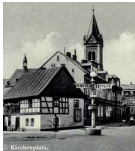
Kirchenplatz (Závodu míru). V popředí hrázdný dům ban untern Hanerich