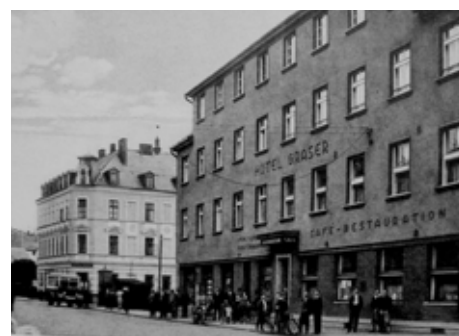
Zleva hotel Siegl č. 1, hotel Graser č. 77 – Hauptstrasse (Závodu míru)