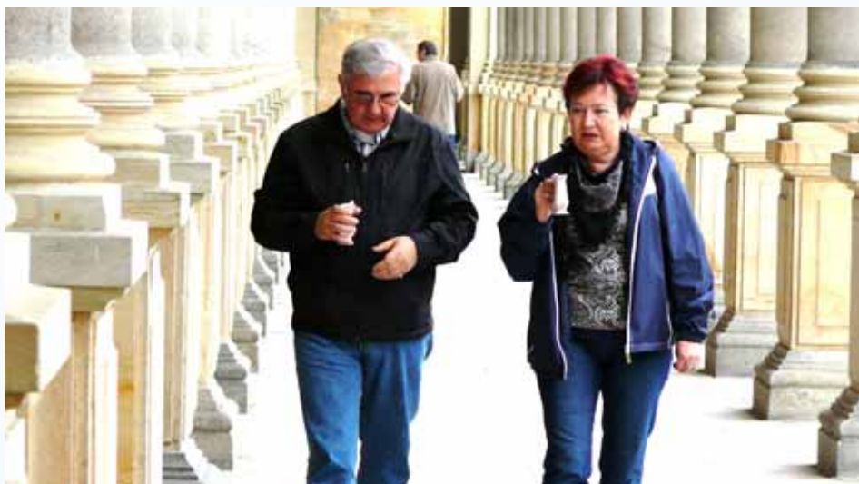
Obrázek pitné kúry na kolonádě se od 17. století moc nezměnil