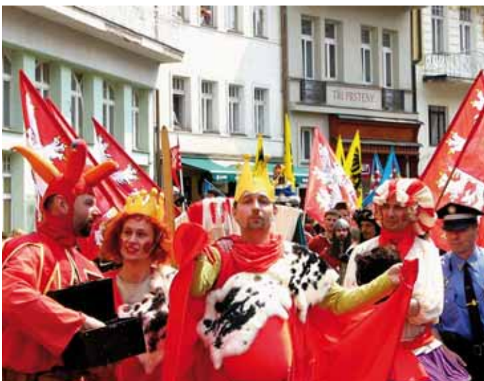
Naše město zahřívá na dva dny všemi barvami