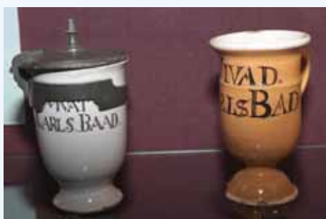
Ještě před porcelánem byla kamenina

Z lázeňských pohárků se stala v minulosti velká móda. Podle toho, z čeho hosté léčivou vodu u pramenů pili, se dalo usuzovat, do jaké společenské vrstvy patří. Králové a šlechtici měli na sklenicích zlaté erby, generálové si libovali v cinových kalíšcích, hraběnky ve zdobené keramice. Důležitým datem v historii lázeňského pohárku byl 19. květen roku 1721. To přijela k Vřídlu manželka císaře Karla VI. s teprve čtyřletou dcerou Marií Terezií. Při pitné kúře popijely poprvé z porcelánového pohárku. Rázem se z toho stala velká móda a míšeňské porcelánce přšely objednávky. Hned v následující lázeňské sezoně pili z porcelánového pohárku z Míšeň také syn císaře Leopolda, císař Karel VI. Habsburský, a jeho