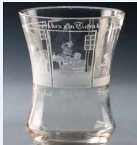
K nejstarším materiálům patřilo sklo