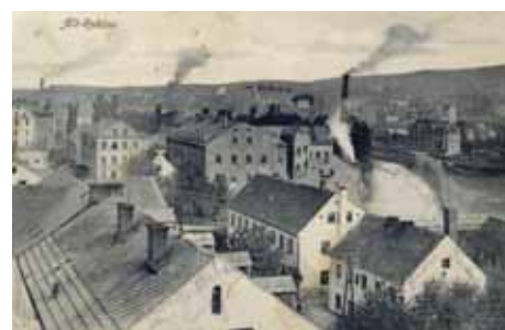
Pohled na porcelánku Epiag v roce 1909

Zatímco v roce 1785 stálo ve Staré Roli jen 34 domů, v roce 1840 jich bylo již 70 a po roce 1860 jejich počet překročil stovku. Koncem roku 1874 měla Stará Role 149 domů a na začátku 20. století 284 domů. V roce 1930 bylo vedle 492 obydlených domů také 28 objektů prázdných. Do nových domů se stěhovali noví obyvatelé. V roce 1854 žilo ve Staré Roli jen 525 obyvatel. Do roku 1880 se jejich počet zvýšil na 2029 osob a během dalších deseti let se zvýšil na 3346 obyvatel. Pak už přibývalo stálých obyvatel po tisícičkách. Na konci roku 1900 měla Stará Role 5358 obyvatel, v roce 1910 více než sedm tisíc a při sčítání lidu v roce 1930 se zde hlásilo k trvalému pobytu 7660 osob. Z toho bylo 7551 Němců, 95 Čechů a 14 různých národností. Před II. světovou válkou byla Stará Role vlastně světovou metropolí výroby porcelánu! Rozmach porcelánek změnil ráz města. Přicházeli sem noví řemeslníci a živnostníci a lidé hledali po práci také zábavu a rozptýlení. Vyrůstaly desítky hostinců. Ve Staré Roli byly tři hotely, 27 hostinců a 3 kavárny. Vysedávalo se zejména v malých jednoduchých lokálech nebo v zahradních hostincích, které byly na Hlavní ulici (dnešní Závodu míru), jako byl Glaser v č. 95, Weidermann v č. 6, nebo v hostinci Allianz – Allianzgasse 130 (Nerudova). Ku-