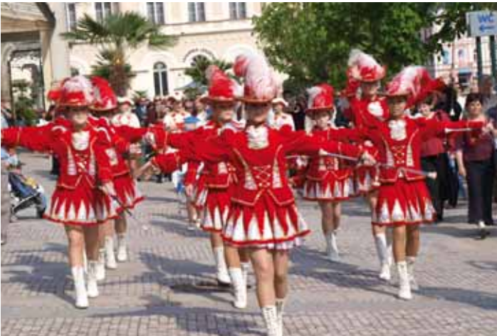
Bez mažoretek se v posledních letech neobešlo žádné zahájení sezony