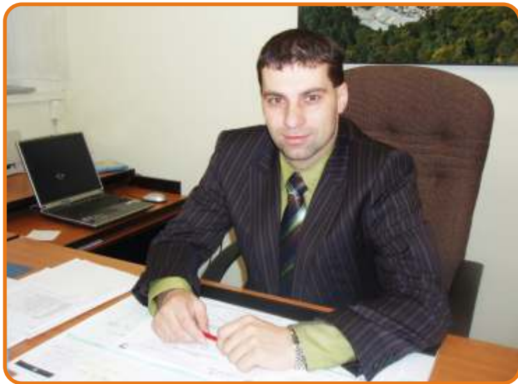
Náměstek primátora města Tomáš Hybner