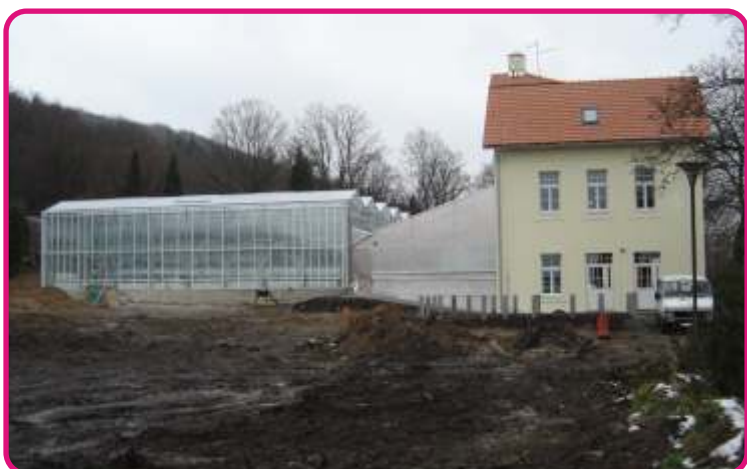
Rekonstrukce zahradnictví v Drahovicích včetně skleníku – 27,5 mil. Kč