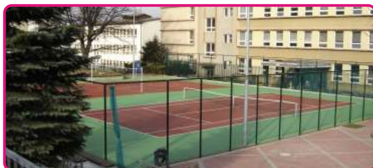
ZŠ Truhlářská ve Staré Roli – víceúčelové hřiště – 9,2 mil. Kč