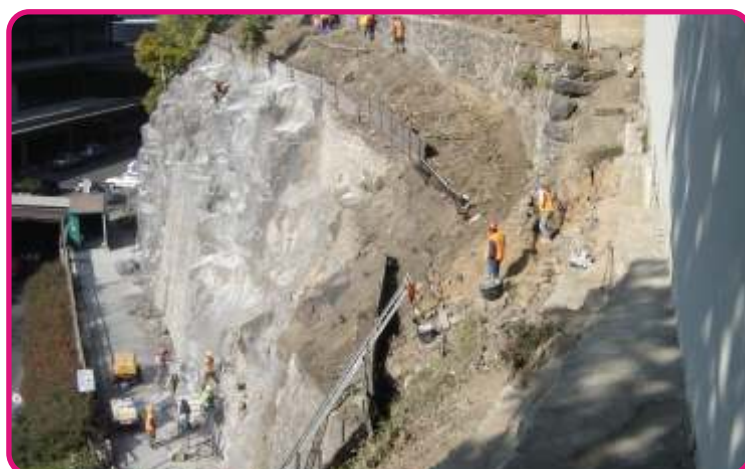
Sanace skalního masivu za Thermalem – 2,7 mil. Kč