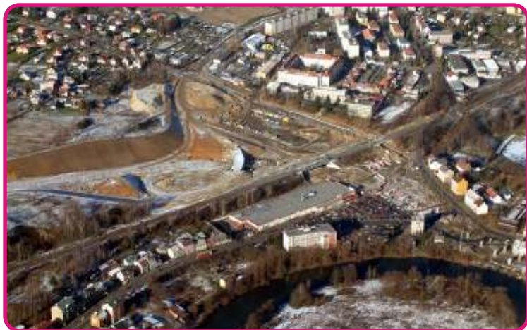
Průtah městem – město spolufinancovalo stavbu částkou 35 mil. Kč