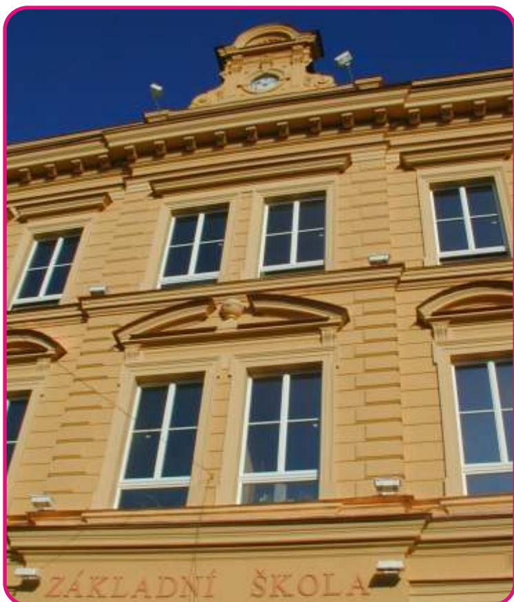
ZŠ Libušina – nová fasáda a výměna oken – 16,2 mil. Kč