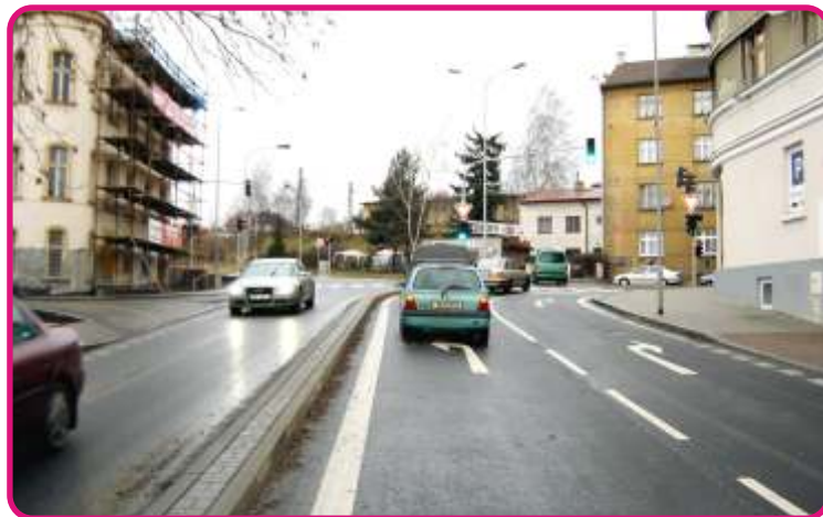
Světelná křižovatka Chebská-kpt. Jaroše – 13 mil. Kč