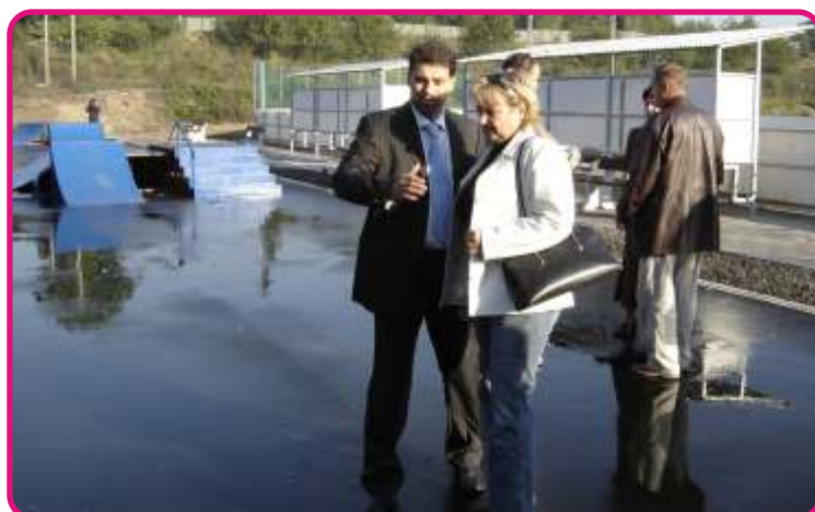
Skatepark Bohatice – další etapa - 2,8 mil. Kč