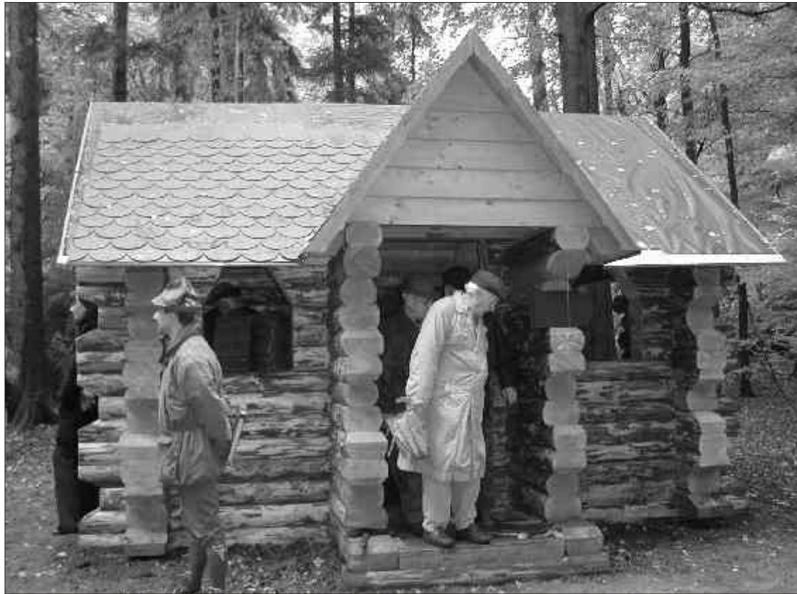
Dosud bezejmenný srub v lázeňských lesích - viz soutěž.