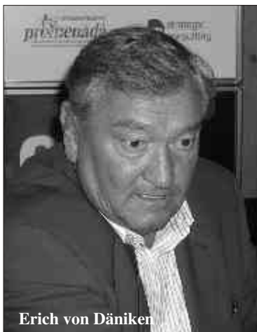
Erich von Däniken

Letošní Tourfilm naznačil cestu, kterou se míní ubírat do budoucna. Tradiční filmovou soutěž obohatil bohatý doprovodný program a značně se rozšířila nabídka pro veřejnost, které se festival začíná více otevírat. Řada doprovodných akcí byla připravena pro mládež.