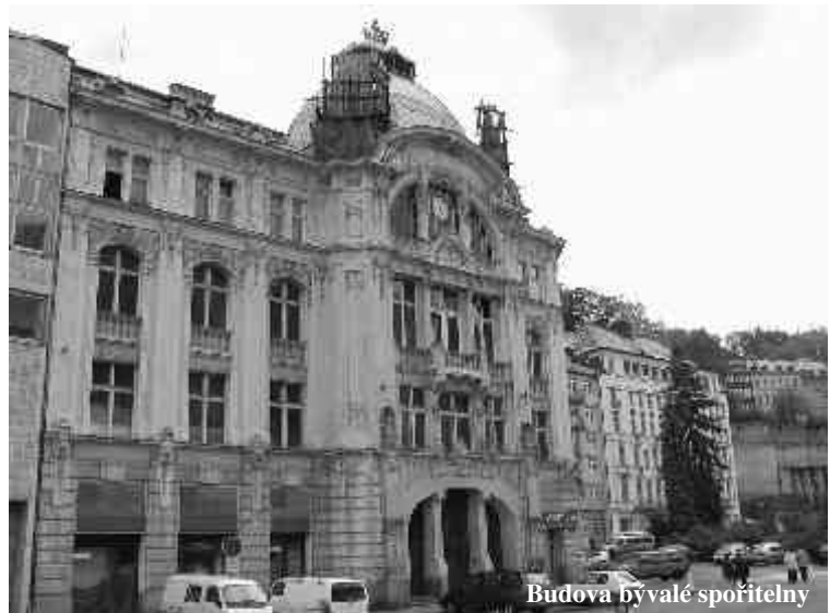
Budova bývalé spořitelny