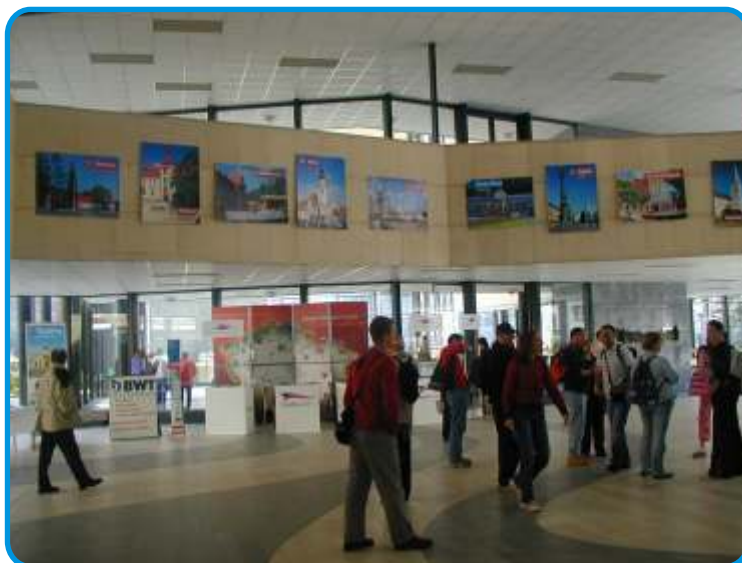
Během Tourfilmu probíhal ve Vřídelní kolonádě i Salón lázeňství

Velkou dynamiku prožívá soutěž multimedií webových stránek a CD ROMů. Právě touto formou probíhá hlavní komunikace cestovního ruchu.