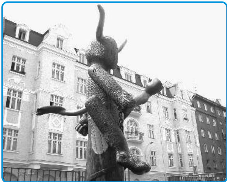
Dětské hřiště na Čertově ostrově hlídá čertík