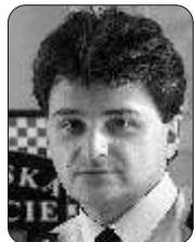
velitel městské policie

Městská policie v současné době využívá dva platební terminály. Jeden je umístěn v jejím sídle na Moskevské ulici, oddělení přestupků, druhý pak brázdí ulice ve Staré Roli. Jde totiž o mobilní