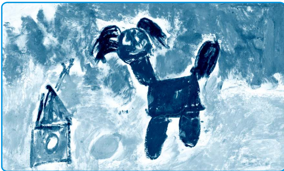
Ilustrace Kristýnka Eisenvortová, MŠ Mládežnická