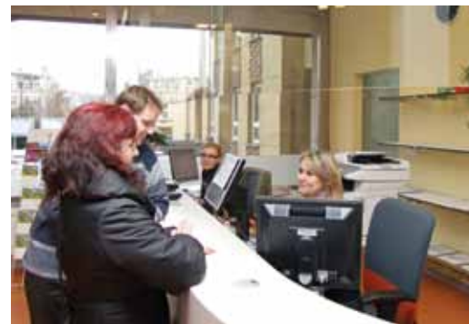
Od loňského roku slouží návštěvníkům magistrátu nové pracoviště informačního pultu ve vstupní hale

Evidence obyvatel řeší především změny trvalého pobytu. Novinkou nedávné doby je pracoviště CzechPOINTu. Umožňuje získat výpisy z rejstříku trestů, katastru nemovitostí, obchodního, živnostenského a insolvenčního rejstříku nebo z bodového hodnocení řidiče – jen vloni jich vydalo přes 5 000. Od konce roku také zřizuje datové schránky