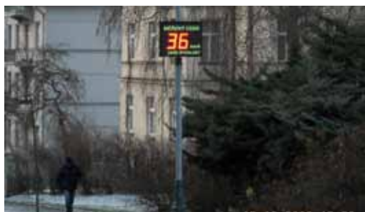
Na problematické úseky ve městě, kde řidiči nejčastěji překračují povolenou rychlost a kde se staly tragické nehody, byly osazeny informativní měřiče rychlosti. Ty řidiče upozorní na příliš rychlou jízdu.

na nebezpečí v úsecích, kde jsou například školy, nebo kde se již v minulosti staly tragické nehody,“ říká předseda komise Michal Řiško.