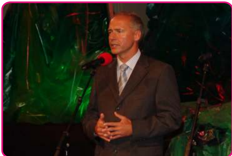
38. ročník festivalu Tourfilm slavnostně zahájil Mgr. Zdeněk Roubínek, primátor Města Karlovy Vary.