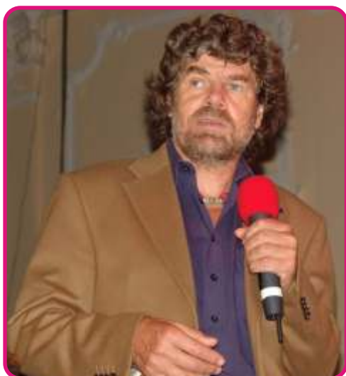
Hlavní hvězda festivalu - horolezec Reinhold Messner.