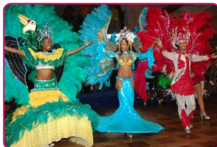
Exotické kraje a karneval v Riu připomínalo vystoupení brazilských tanečniců na slavnostním zakončení Tourfilmu 2005.