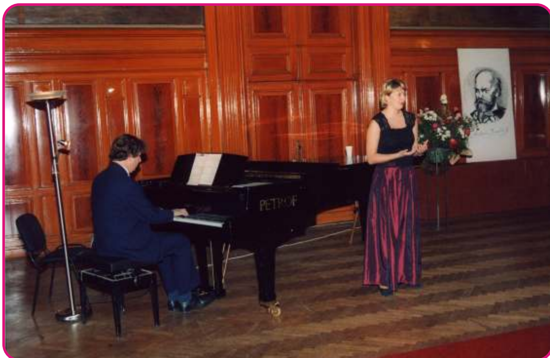
Záběr ze soutěže v roce 2003 v Lázních I

Časy soutěžních vystoupení jsou v závěru každého dne orientační