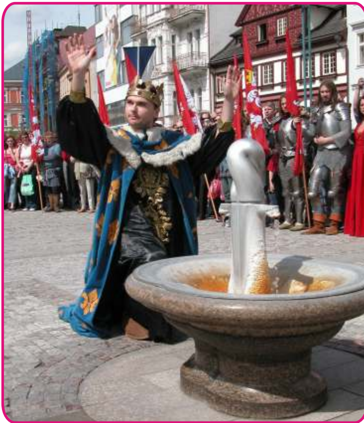
Foto ze zahájení lázeňské sezóny

Podrobné informace o konferenci na www.twinconference.cz