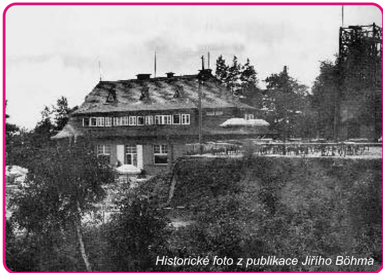
Historické foto z publikace Jiřího Böhma

Vítkova hora byla od třicátých let minulého století, kdy zde byla vystavěna výletní restaurace, vyhledávaným cílem nedělních vycházek. Stávala tu dokonce dřevěná vyhlídková věž. Na konci století areál, tehdy včetně bungalovů, osířel. Od loňského podzimu ale již zrekonstruované objekty opět slouží svému původnímu účelu. A tak si můžete zpříjemnit volné dny hezkým výletem.