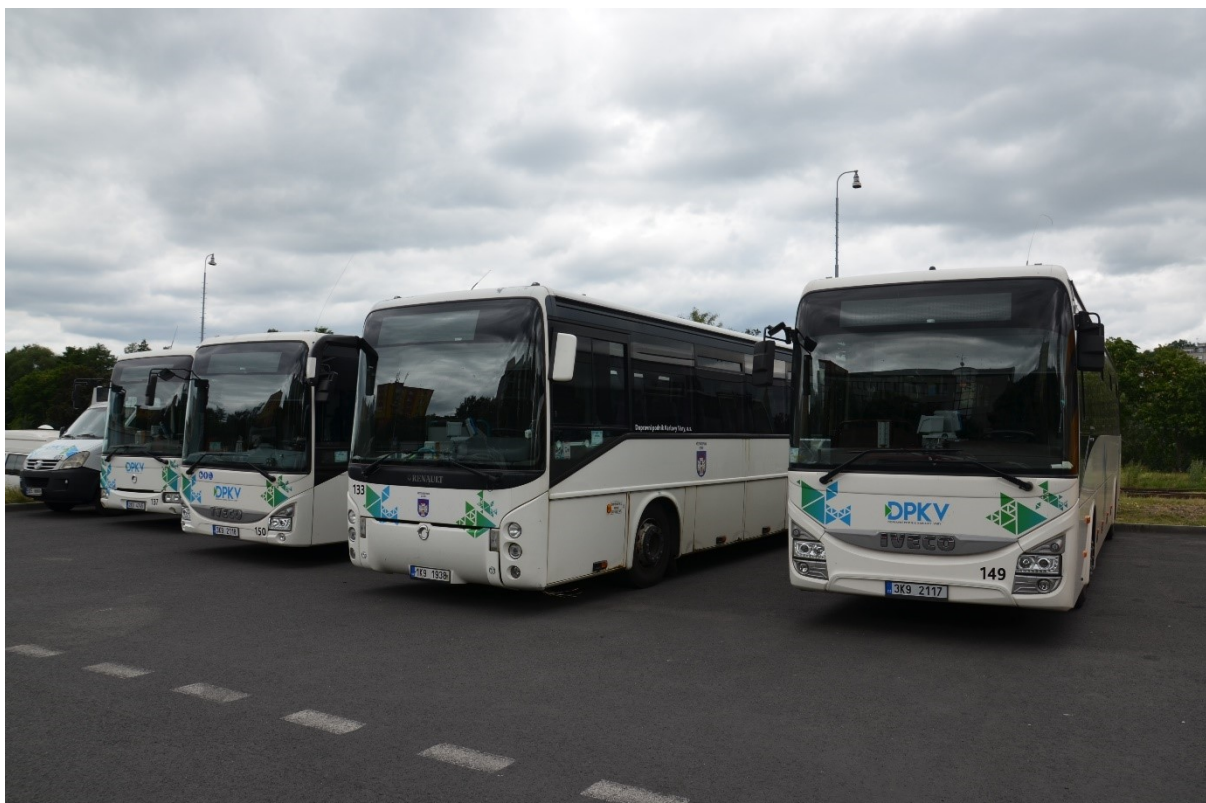
Autobusy pro příměstské linky DPKV zaparkované na Dolním nádraží.

Tarif MHD nelze zatím kombinovat s tarifem linkové dopravy, s integrací se ale počítá (srov. bod 8 tohoto plánu). Na trase Karlovy Vary, Terminál – Karlovy Vary, Počerny na linkách 421210 Ostrov-Karlovy Vary-Vintřov a 421703 Karlovy Vary-Chodov-Vřesová platí průkazky MHD a bezplatná přeprava pro držitele průkazů ZTP, ZTP/P včetně průvodce a psa 7 .