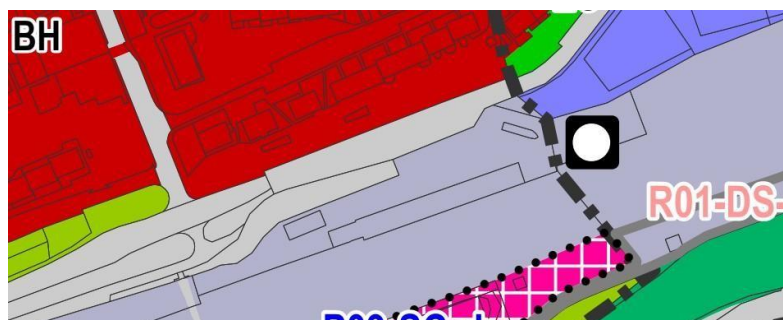
Obr.: vyznačení předmětné plochy na podkladu katastrální mapy a na podkladu platného ÚP

Připomínka má partikulární charakter – její