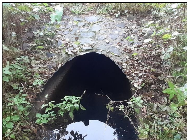
Celkový pohled na objekt