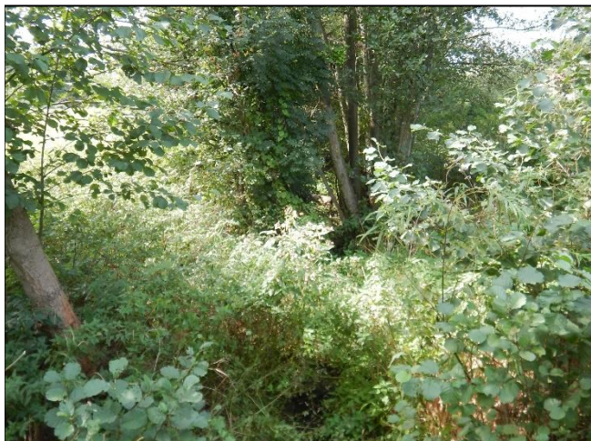
pohled na koryto z (od) objektu po vodě