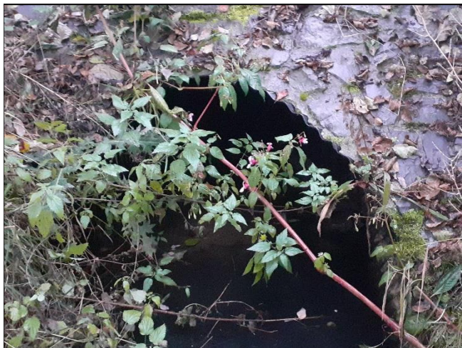
pohled z horní vody na objekt