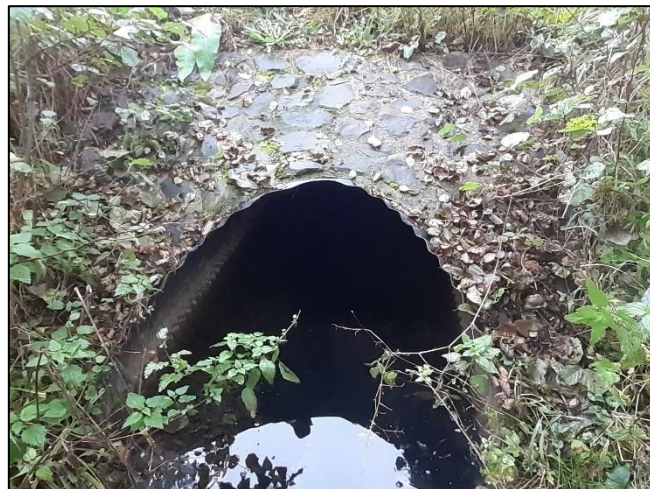
pohled z dolní vody na objekt