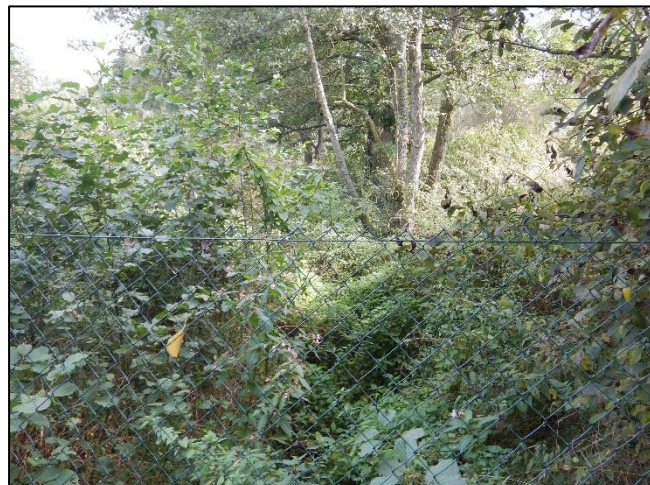
pohled na koryto z (od) objektu proti vodě