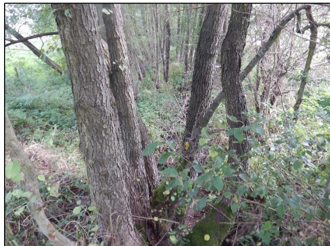
pohled na koryto z (od) objektu proti vodě