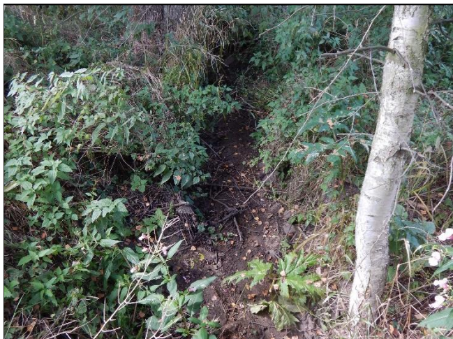
pohled na koryto z (od) objektu po vodě