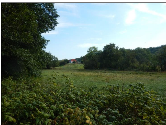
pohled do LB území