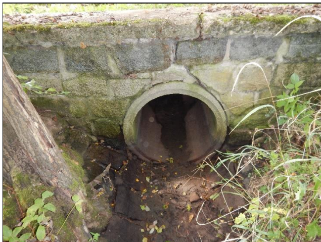
pohled z horní vody na objekt