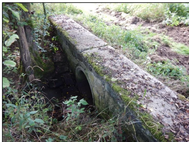
Celkový pohled na objekt