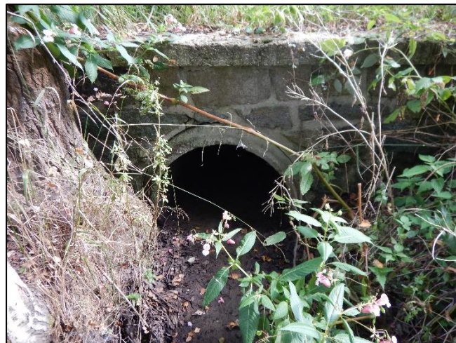
pohled z dolní vody na objekt