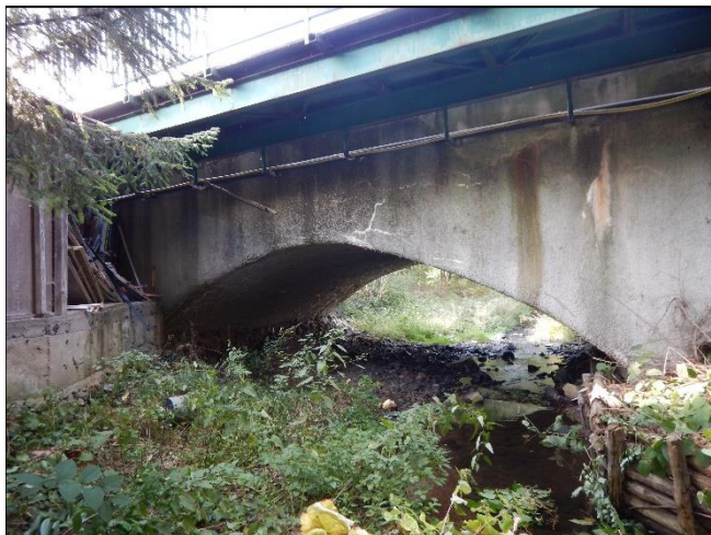
pohled z horní vody na objekt