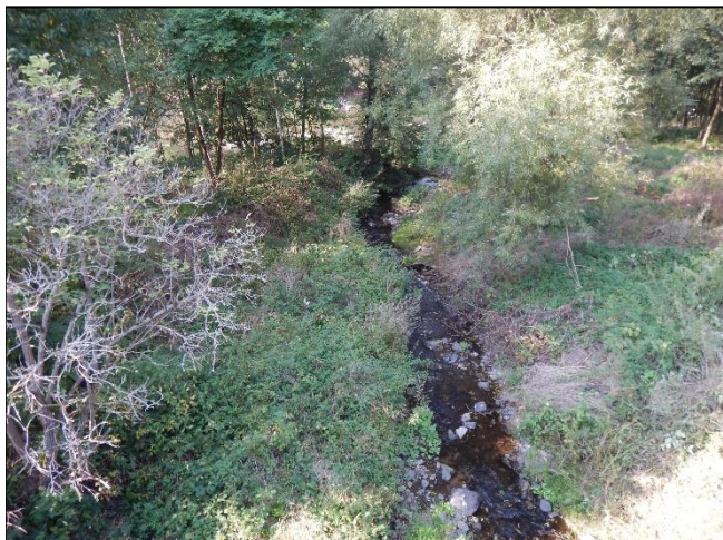
pohled na koryto z (od) objektu po vodě