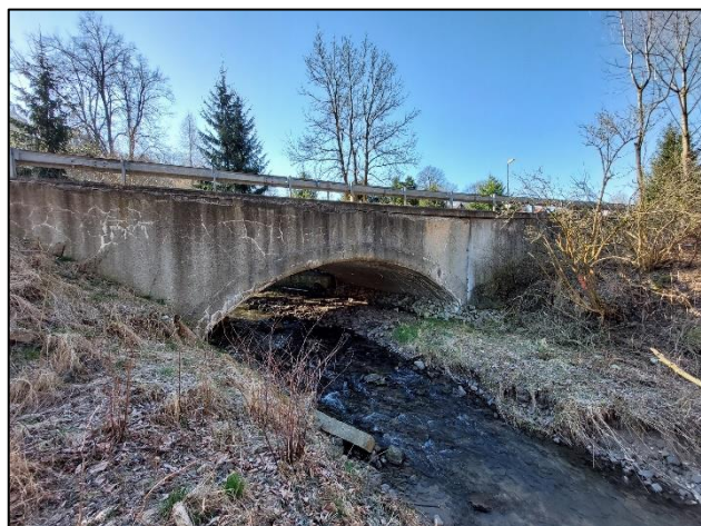
Celkový pohled na objekt