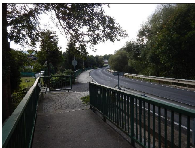
pohled do LB území