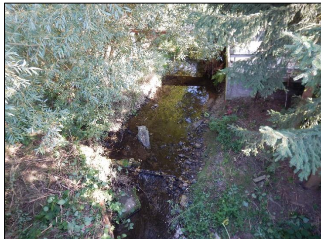
pohled na koryto z (od) objektu proti vodě