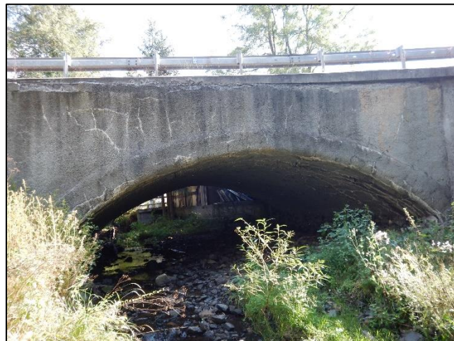
pohled z dolní vody na objekt