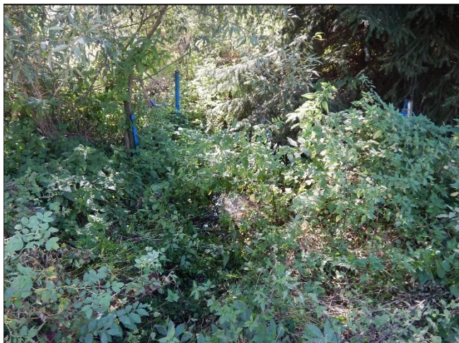
pohled na koryto z (od) objektu po vodě