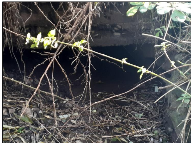
pohled z dolní vody na objekt