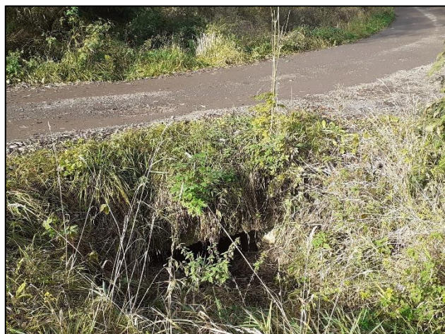
Celkový pohled na objekt