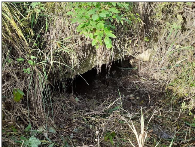
pohled z horní vody na objekt