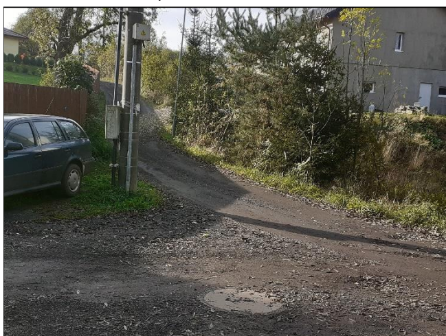
pohled do LB území