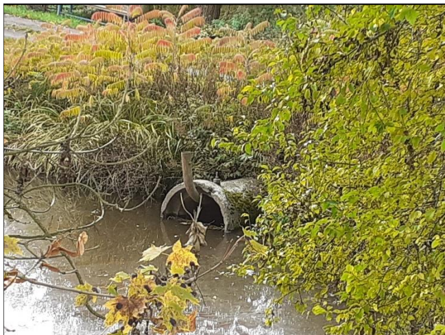
pohled z horní vody na objekt