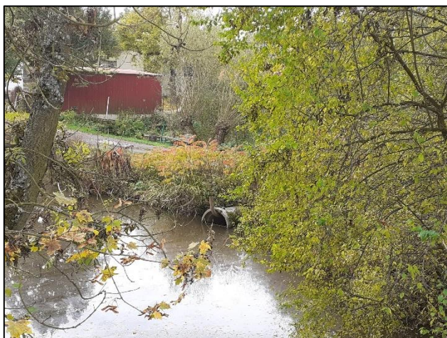
Celkový pohled na objekt

hráz rybníka a cestní betonový propustek DN 900