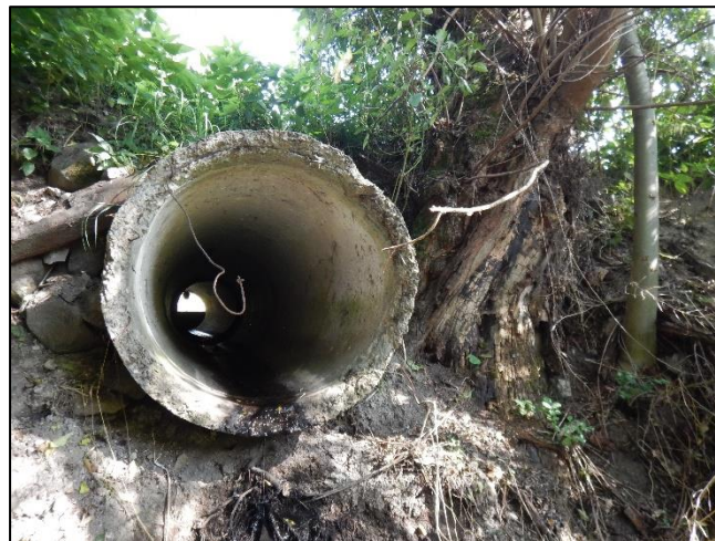
pohled z dolní vody na objekt