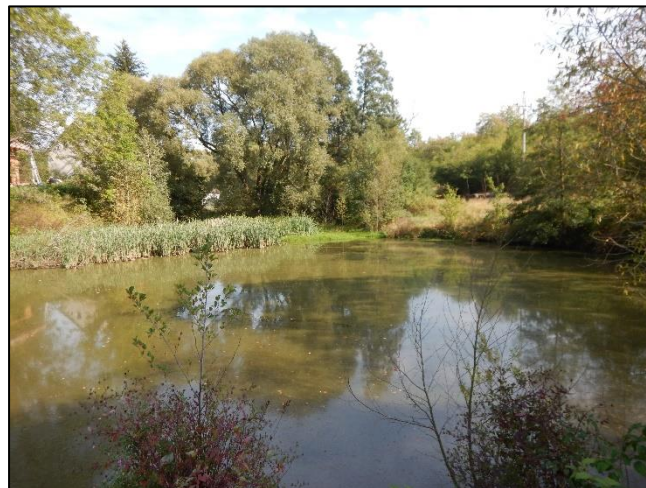
pohled na koryto z (od) objektu proti vodě