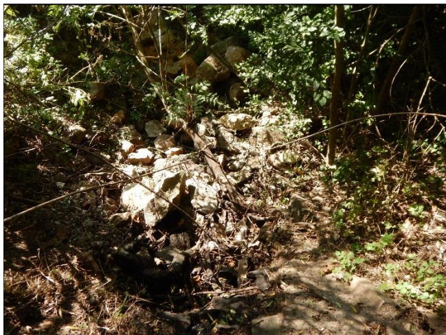
pohled na koryto z (od) objektu po vodě