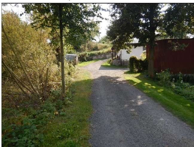
pohled do LB území