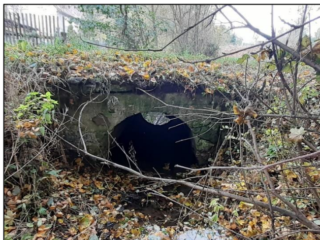
Celkový pohled na objekt