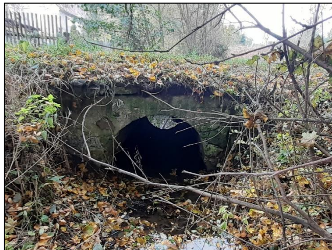
pohled z dolní vody na objekt