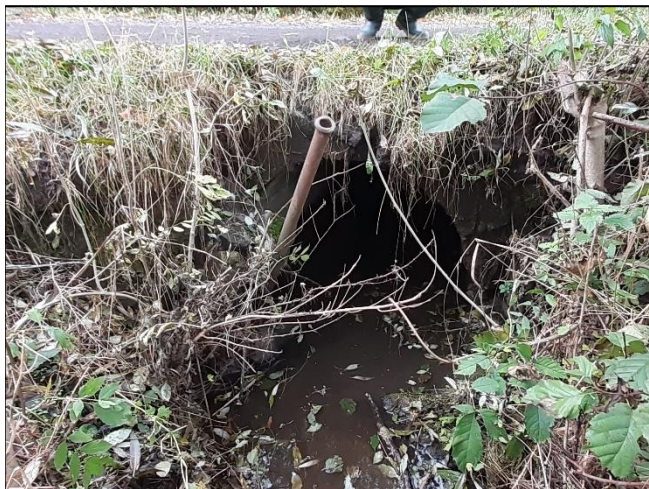
pohled z horní vody na objekt