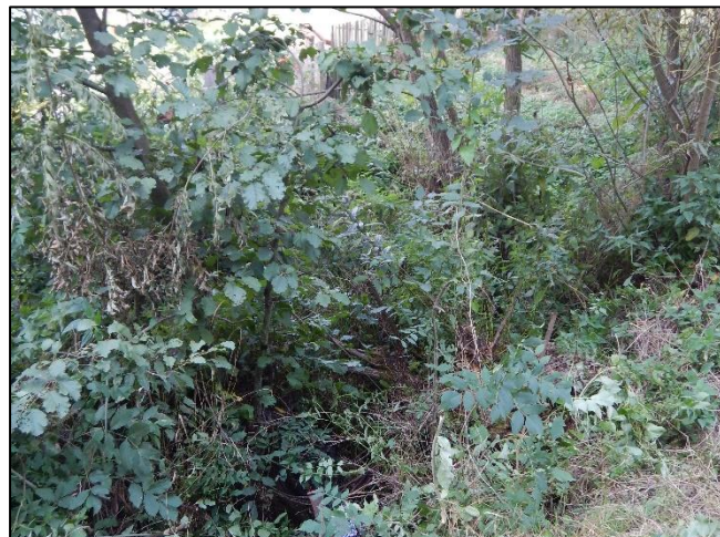
pohled na koryto z (od) objektu proti vodě