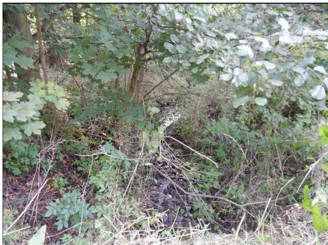
pohled na koryto z (od) objektu po vodě