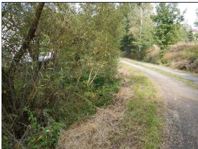
pohled do LB území