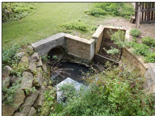
Celkový pohled na objekt