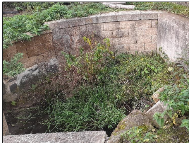
pohled na koryto z (od) objektu proti vodě