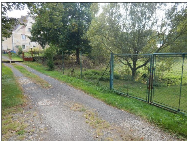
pohled do LB území