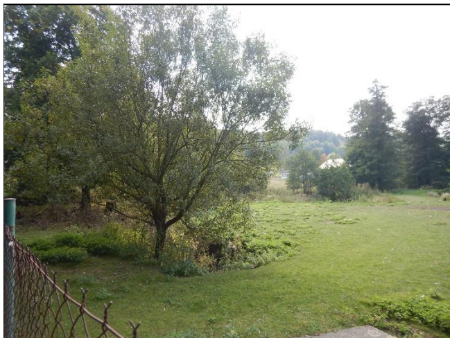
pohled na koryto z (od) objektu po vodě