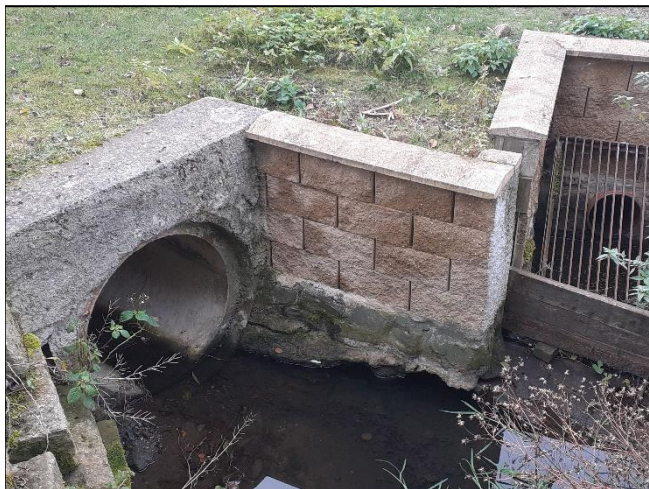
pohled z horní vody na objekt