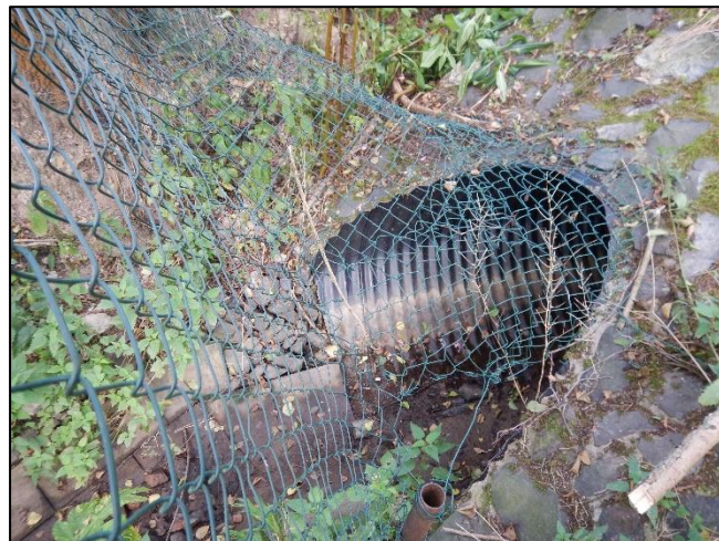
pohled z dolní vody na objekt