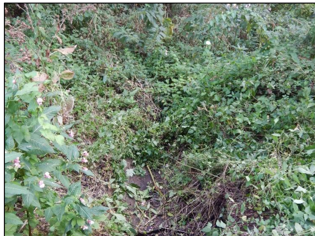
pohled na koryto z (od) objektu proti vodě