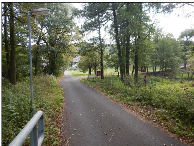
pohled do LB území