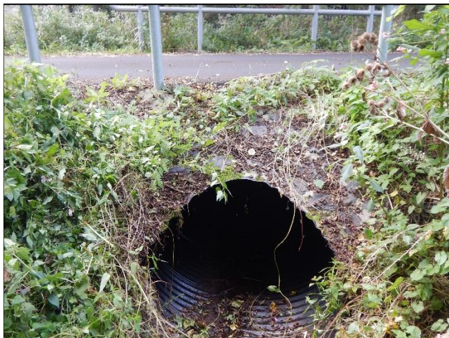
pohled z horní vody na objekt