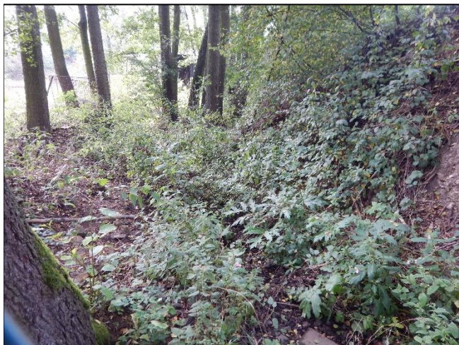
pohled na koryto z (od) objektu po vodě