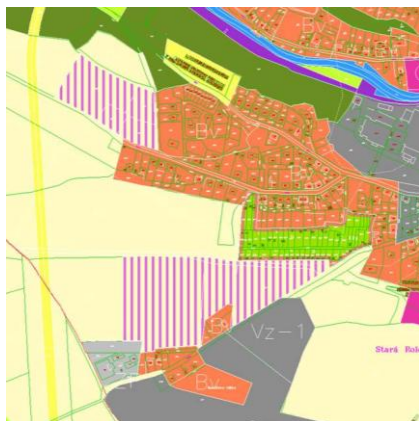
č. 1 a 2