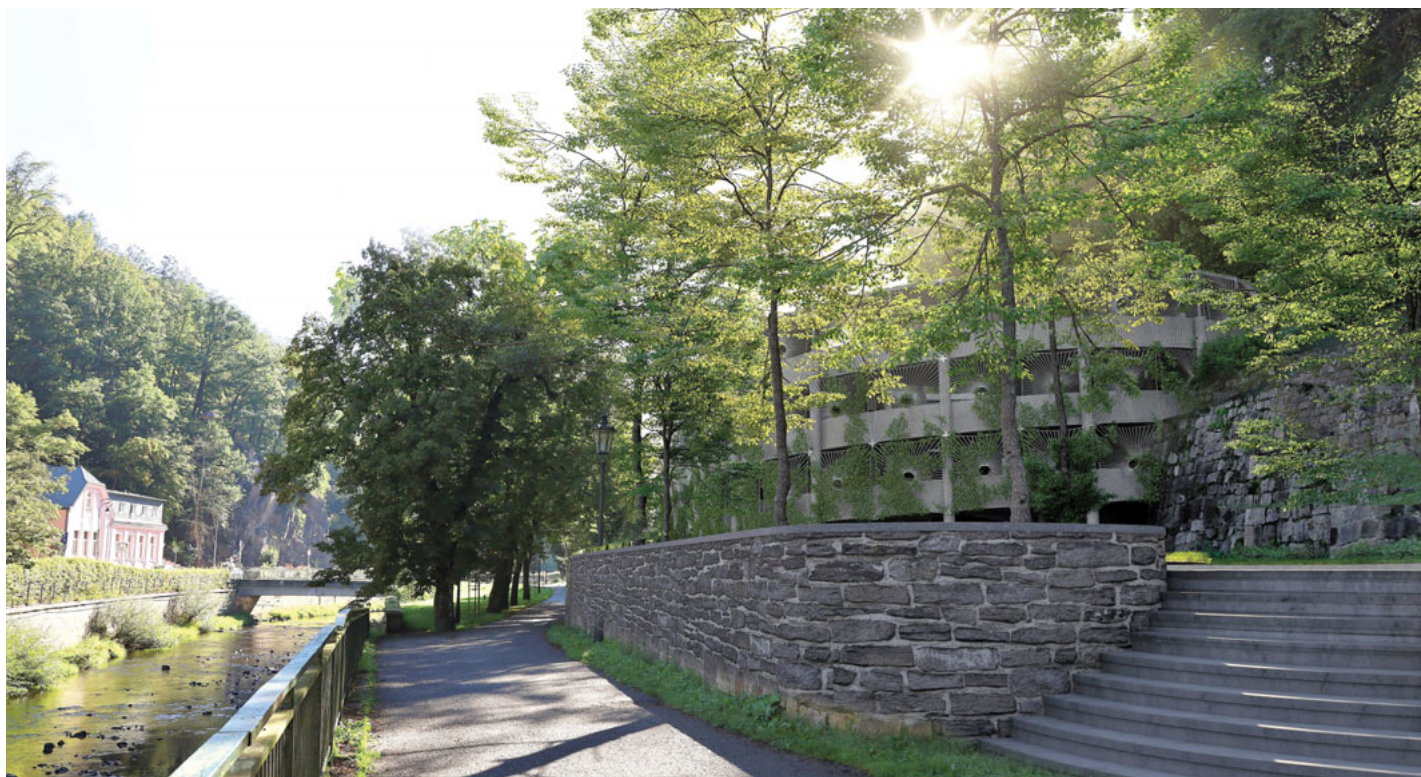
PD U Galerie (Fránek Architects)

S výstavou nových parkovacích domů město Karlovy Vary počítá dlouhodobě již ve svých koncepčních dokumentech, jako je územní plán nebo generel dopravy. Systém záchytných parkovacích domů na okrajích města umožní návštěvníkům města i obyvatelům svůj vůz bezpečně odstavit a dále pokračovat do lázeňského centra nebo do svých domovů. Kancelář architektury města Karlovy Vary (KAM KV) ve dvou poptávkových řízeních vybrala architektonické kanceláře, které zpracovaly studie parkovacího domu U Galerie a v ulici Polská.